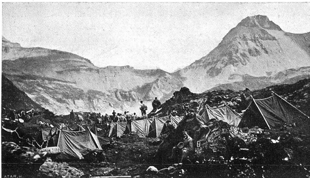
2. Le bivouac de Corgneules (à 2550 m.). (Au fond, le col de Fenestral. A droite, plus haut, le Faux-Col.)