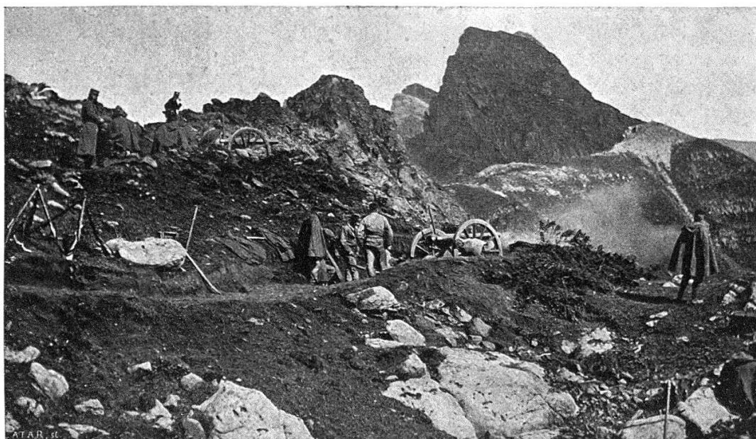
1. Les canons de 8.4 à Corgneules.