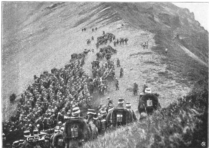
Fig. 1. — Le Détachement blanc se rassemble au col de Fenestral.