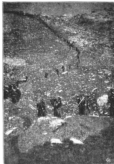
Fig. 4. — Une marche le 3 septembre.