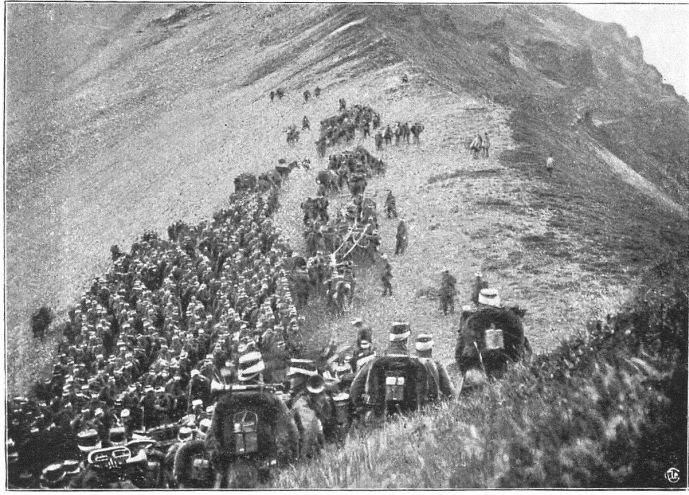
Fig. 1. — Le Détachement blanc se rassemble au col de Fenestral.