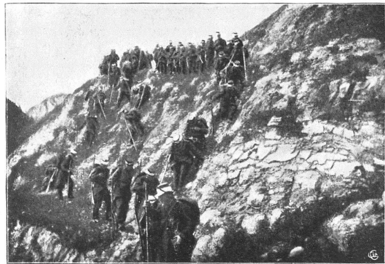
Fig. 3. — Les rochers sous la Tita à Sery.