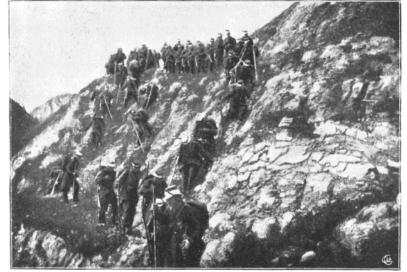
Fig. 3. — Les rochers sous la Tita à Sery.