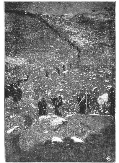
Fig. 4. — Une marche le 3 septembre.