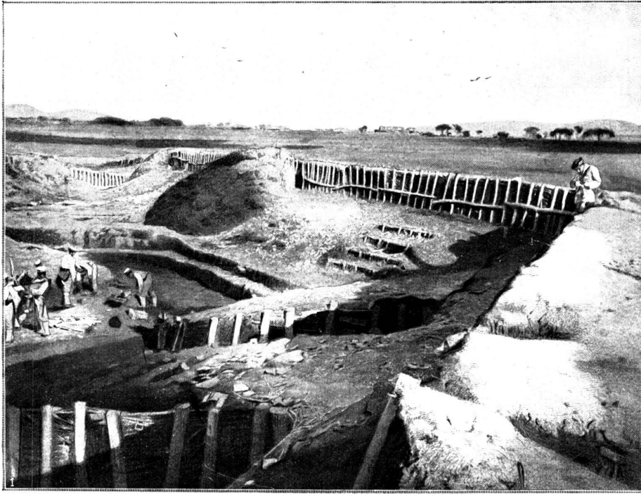
La grande redoute de Liao-Yang