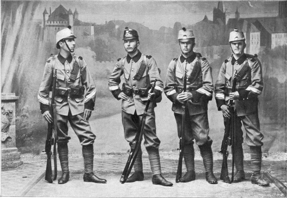
Le nouvel équipement de l'infanterie. — Essais de 1907.