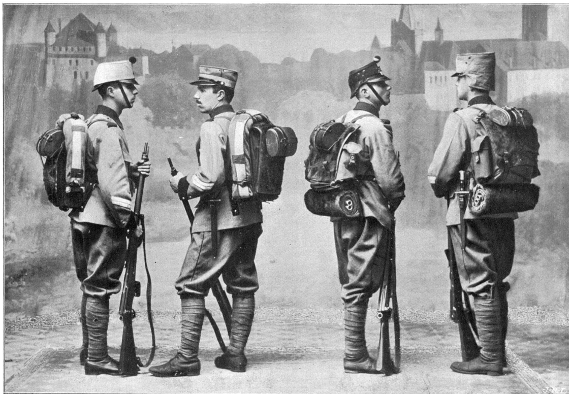
Le nouvel équipement de l'infanterie. — La coiffure et le havresac.