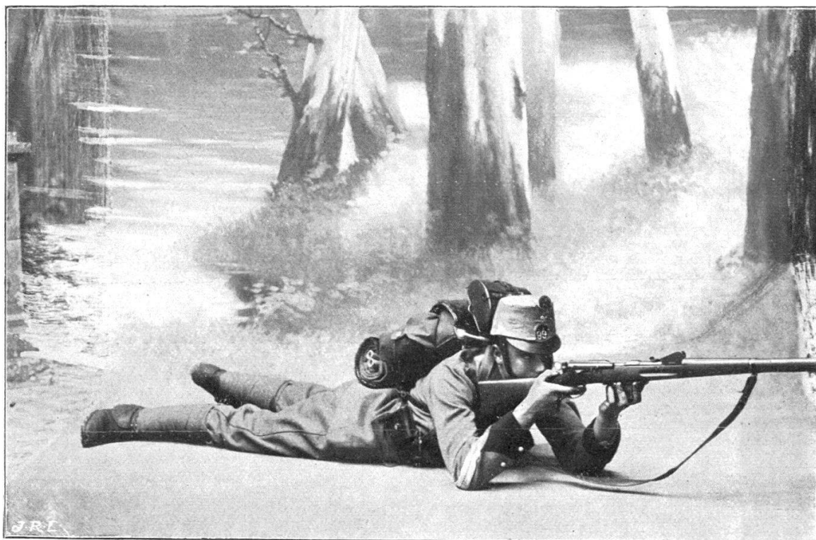
Le nouvel équipement de l'infanterie. — Essais de 1907.