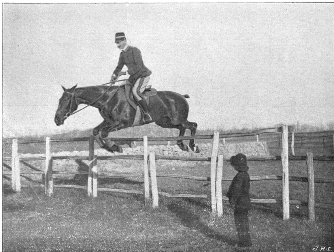
FIG. 2. — Le Capitaine Caprilli.