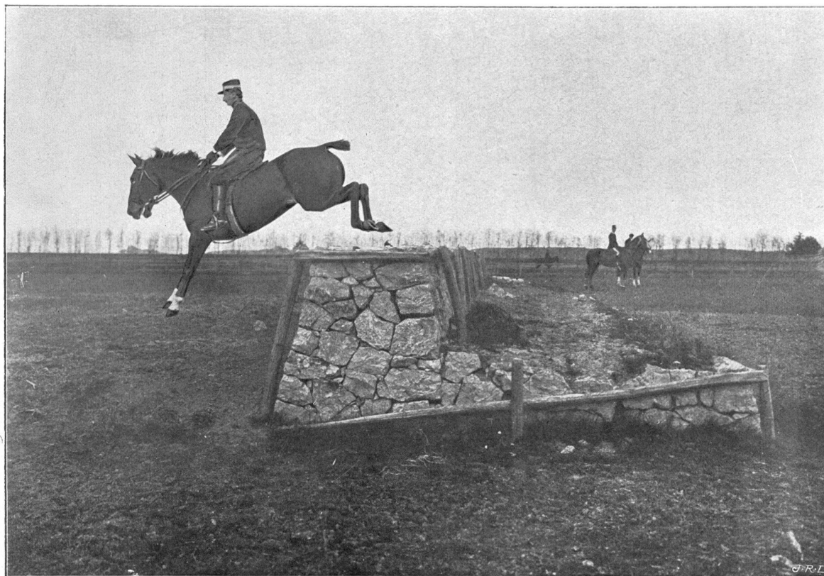
Le Parapet, dit le « Piano-Forte »