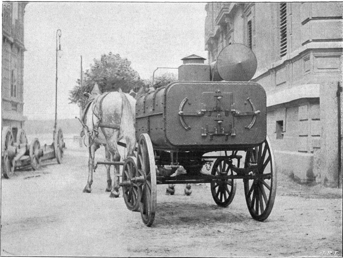
FIG. 3. Four mobile Lemaire et Gavin. Modèle moyen