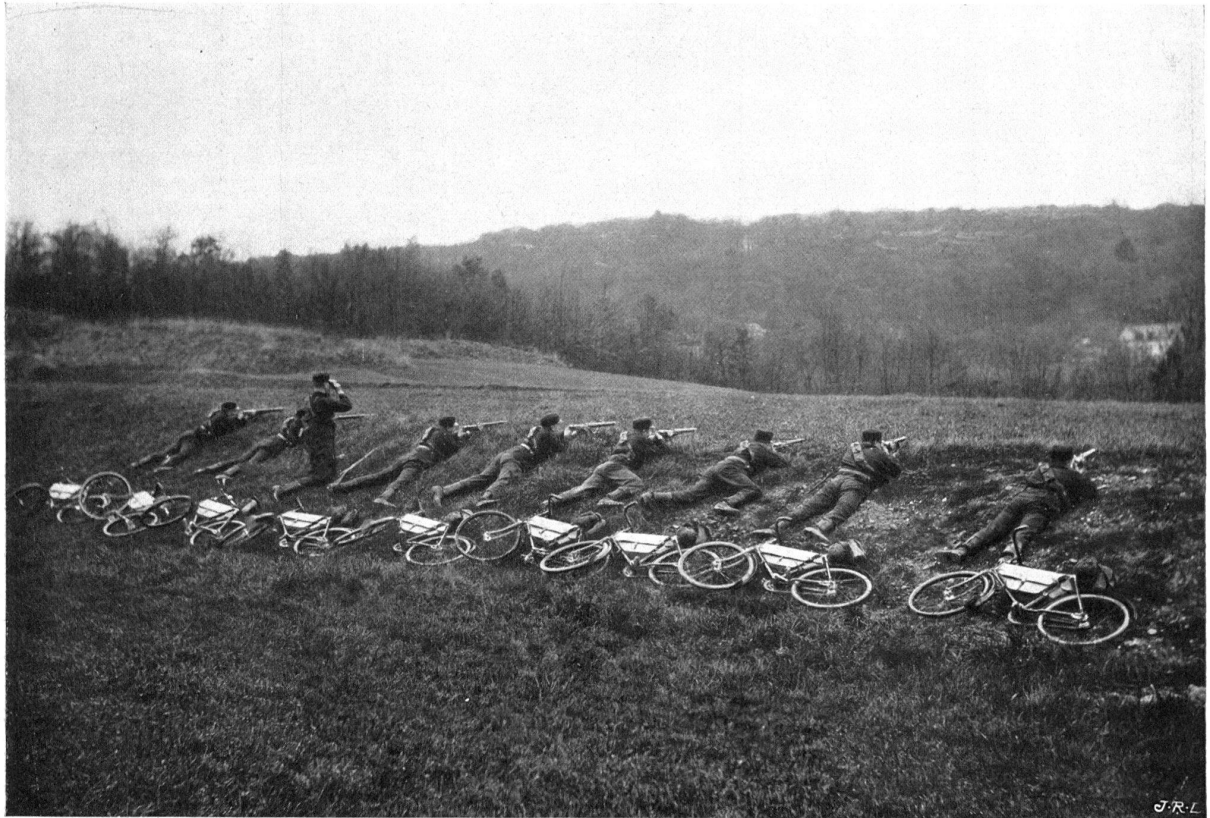
Tirailleurs cyclistes. Les machines derrière les hommes.