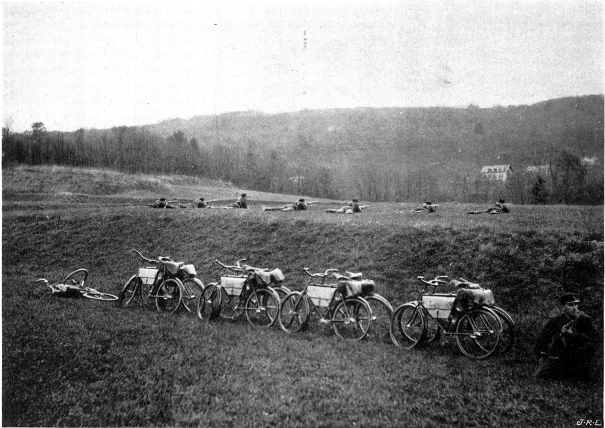
Tirailleurs-cyclistes. Les machines en arrière sous la protection d'une garde.