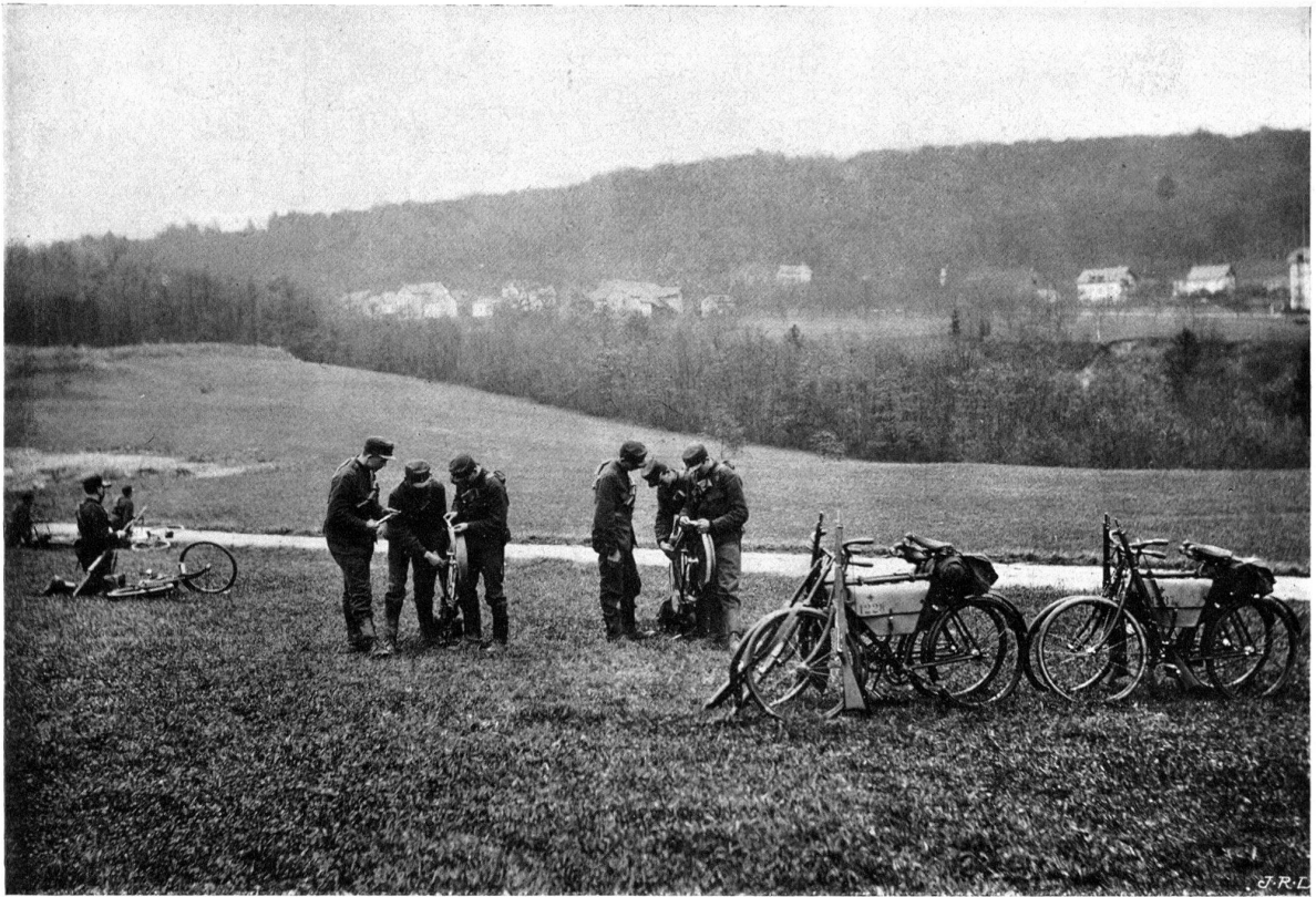
Réparations en cours de route.