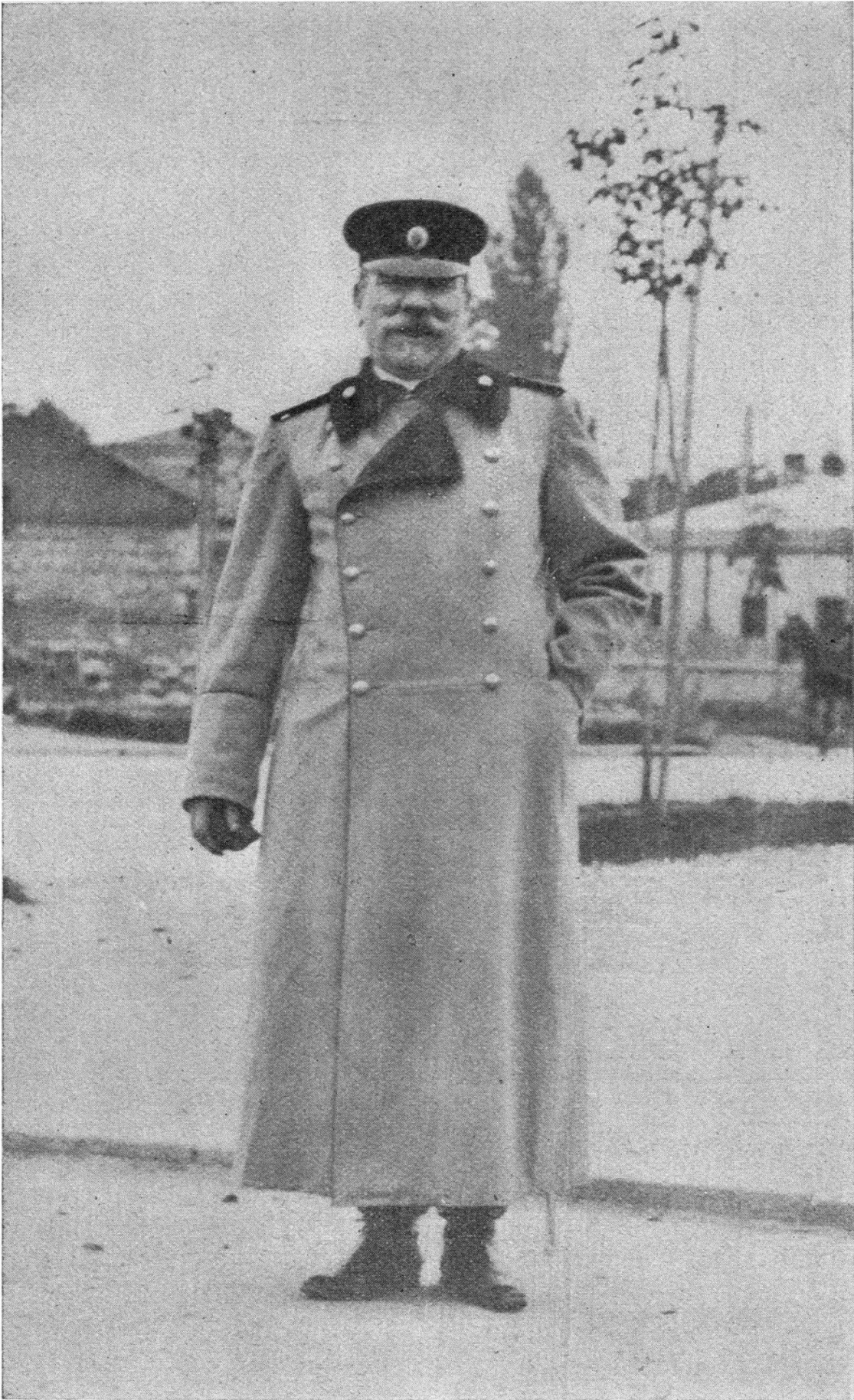
Le général Savoff.