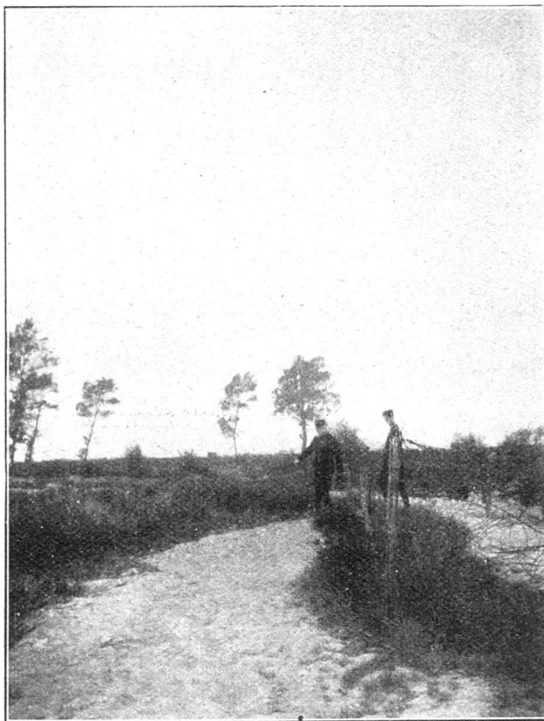
Poste de guetteur dans l'inondation.

Instruits, intelligents, ayant subi une instruction très com-