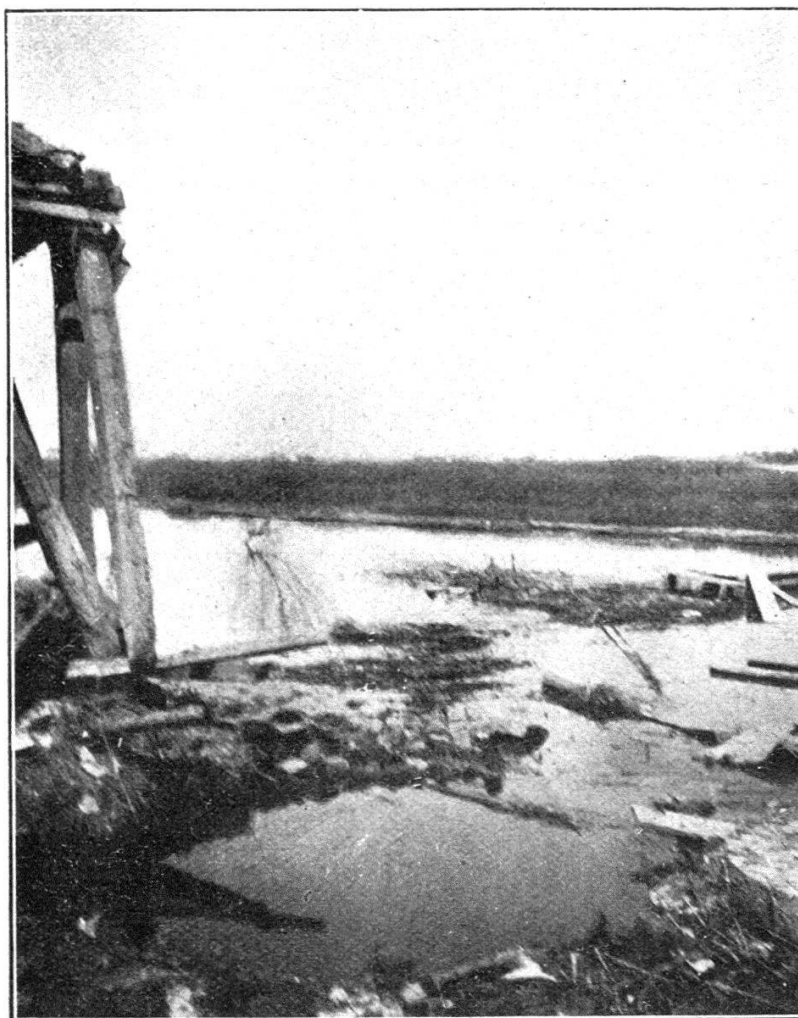
Un poste d'écoute en pleine inondation.

Il est brave de cette bravoure énergique, volontaire, têtue,