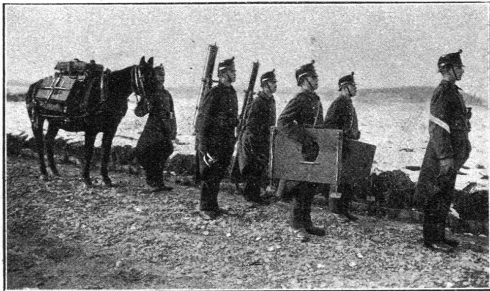
11. Mitrailleurgruppe mit Munitions Pferd; die Schildlafetten hängen am Strick.

Charrette avec 2 mitrailleuses, 2 affûts-boucliers, 1 cacolet à munitions, 2 cacolets vides sur le bât.