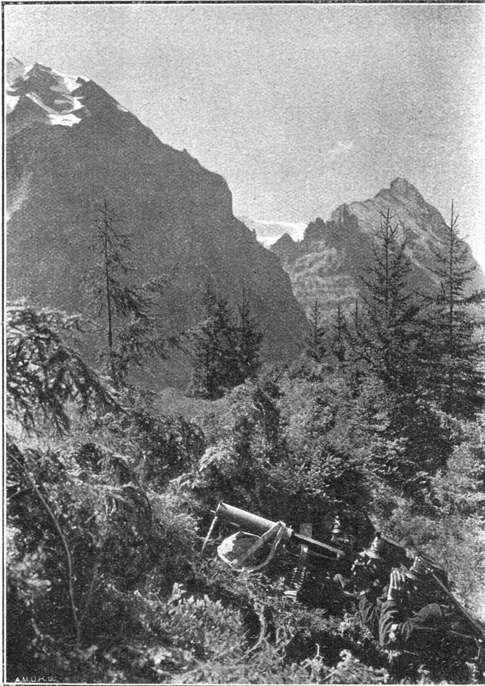
8. Ein gut maskiertes Maschinengewehr mit Dreifuss. Une mitrailleuse sur trépied bien masquée.

Nous complétons la collection des photographies qui accompagnent les articles du colonel Immenhauser parus dans nos livraisons de février et mars de cette année.