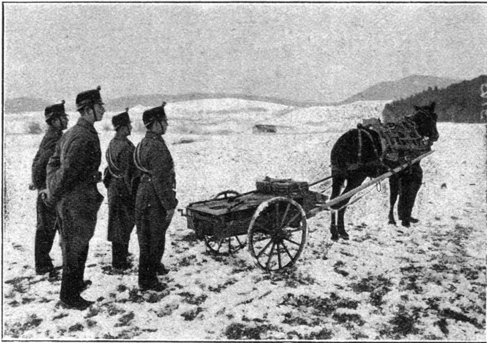
10. Karren mit 2 Maschinengewehren, 2 Schildlafetten, 1 Munitionsreff, 2 leere Munitionsrefe auf dem Bastsattel.

Charrette avec 2 mitrailleuses, 2 affûts-boucliers, 1 cacolet à munitions, 2 cacolets vides sur le bât.