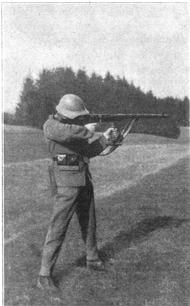
Fig. 4. Tir debout.

Le tir coup par coup est un tir d'exception. Par conséquent l'arme automatique agissant surtout par surprise, elle sera souvent contrainte de ne se dévoiler qu'au dernier moment. Le tir coup