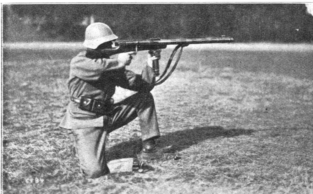
Fig. 3. Tir à genou (la main gauche tient l'arme par l'appui fixé au milieu).

d'utiliser tous les gaz pour le tir proprement dit. Un des grands avantages que présente la construction de notre F. F. est que toutes les pièces de la culasse ne subissent qu'une « pression » correspondant au travail à fournir. L'ouverture de la culasse se fait sans choc. On n'utilise que l'énergie nécessaire à l'extraction et à l'éjection du culot. La combustion de la poudre étant retardée (feuillettes graphitées et recouvertes d'un sel