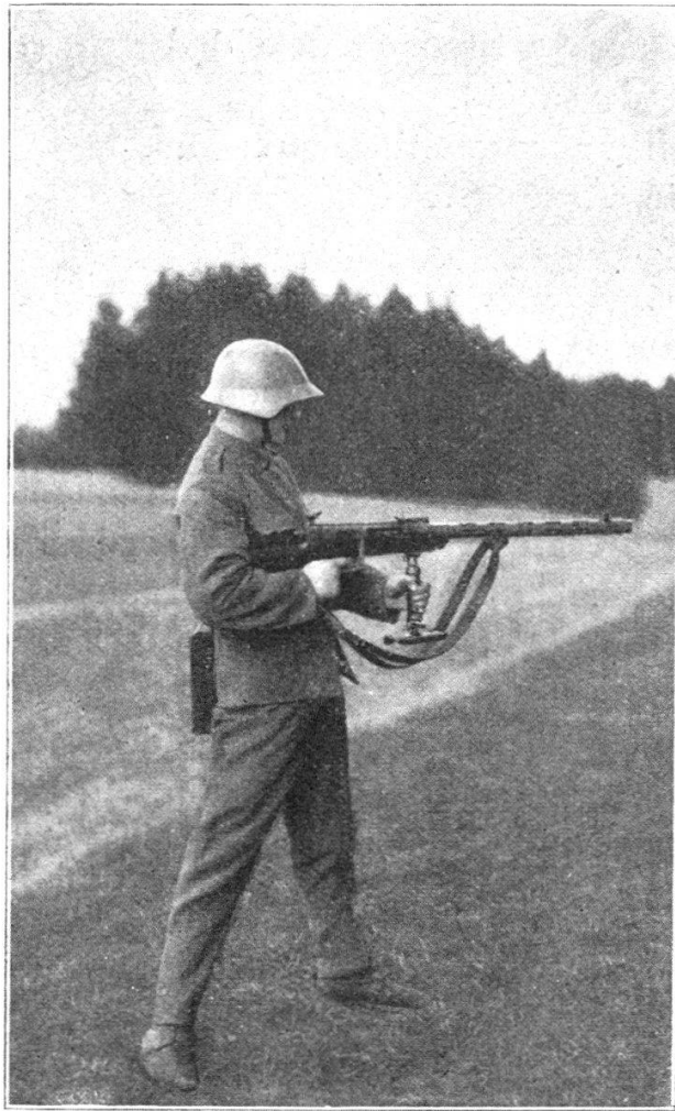
Fig. 5. Tir l'arme sous le bras (le tireur règle son tir en observant l'arrivée des projectiles).

tions plus difficile. Les hommes de l'équipe ne sont plus des tireurs isolés, mais des servants, ayant chacun une tâche précise à remplir vis-à-vis de leur arme. Dans l'emploi de toute arme automatique, il faut que le personnel, le matériel accessoire et le ravitaillement en munitions assurent la continuité du feu.