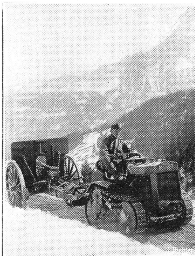
Tracteur tirant une pièce d'artillerie à sa position de tir.

Actuellement, chaque arme possède chez nous un train-automobile ; d'autre part, voici les troupes qui ont été motorisées, et pour lesquelles le moteur a donc remplacé désormais le cheval : en plus du service automobile lui-même, toutes les