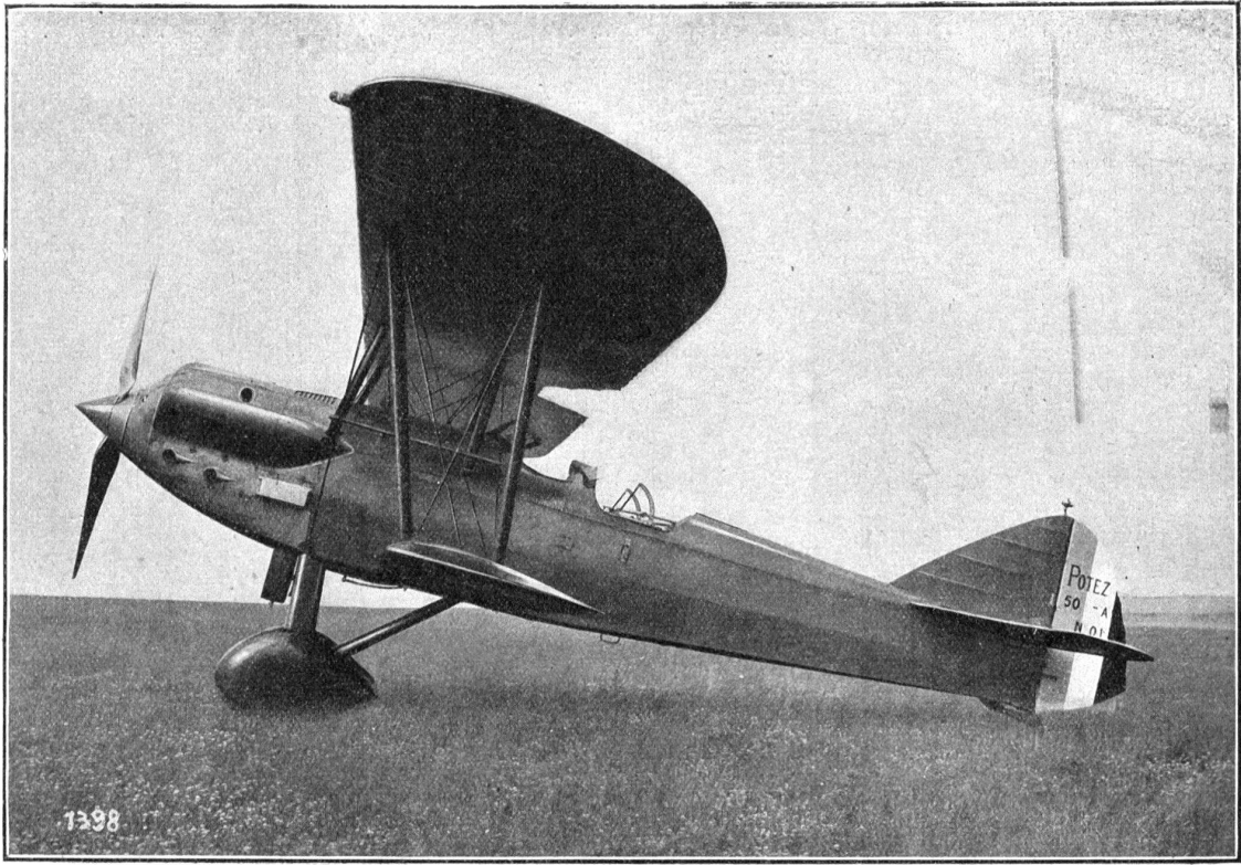
L'avion militaire français Potez 50 A 2 (600_C.V.), appareil d'observation et de reconnaissance.