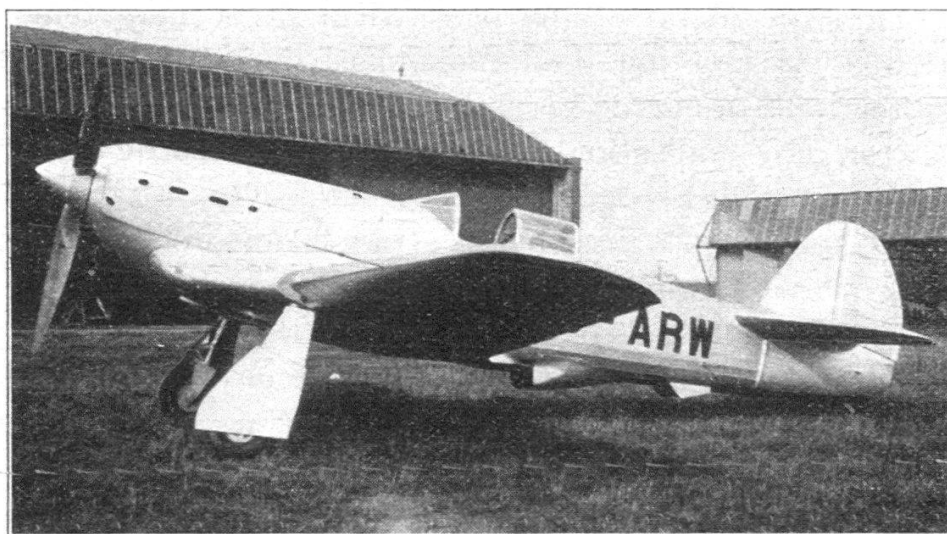
L'avion de chasse R.36, de conception et de construction belges.

Le R.36 est équipé avec le moteur Hispano-Suiza Ycrs, 12 cylindres, à compresseur, lequel actionne une hélice métallique tripale dont le pas est réglable au sol seulement. La puissance maximum est de 900 CV à l'altitude de 4000 mètres.