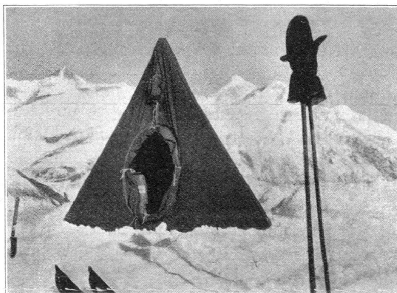
La tente à Riffelboden.

La toile étant évasée à la base, l'ancrage au sol est simplement assuré par un muret de neige construit sur la base de la tente. Il s'agit donc d'un ancrage poids , contrairement à l'ancrage piquets des autres modèles de tentes.