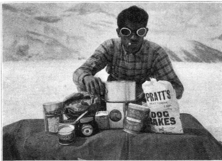
Les rations de vivres.

La technique polaire étant à la base des essais de la Station, les transports avaient été prévus, comme au Grand Nord, par traîneau. La Station possédait à cet effet un