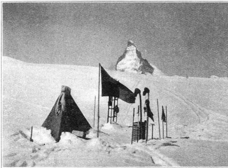
Camp au Riffelsee.

Malgré ses inconvénients, la base triangulaire ne saurait être modifiée, transformée en carré ou pentagone par exemple, sans perdre la précieuse qualité de stabilité du tripode en tous terrains. De nombreuses expéditions polaires ont utilisé des tentes à 4 ou 5 côtés ; il faut tenir compte, en ce cas, de ce que l'Ice Cap polaire est relativement plat ;