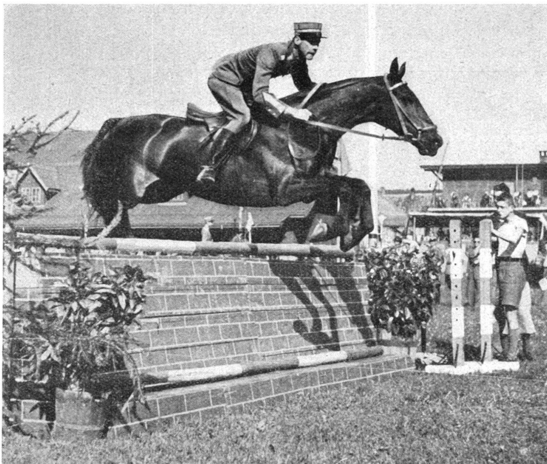
FIG. 2. — Le Plt. M. Stauffer et son « crack » irlandais Rinaldo , un des meilleurs chevaux de concours actuels, en Suisse.

du sport hippique au moment où les batailles se sont tues : plus qu'aucune autre compétition, les joutes équestres sont bien faites pour jeter des ponts entre les jeunesses de tous les pays. Dans le fair-play, elles oublieront le manque d'égards et la brutalité guerrière. Le cheval sera le meilleur ambassadeur de la confiance.