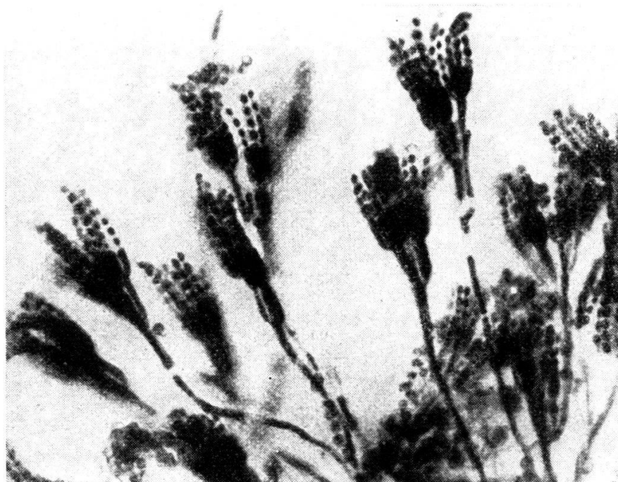
Le penicillium notatum , moisissure productrice de la pénicilline, vu au microscope à un grossissement de 500 fois. Remarquer la forme en pinceau qui a valu à cette moisissure son nom.

façon désastreuse l'action de ce médicament. Nous nous garderons de verser dans l'énoncé de maladies sans fin, car cela n'est pas de notre ressort. Mais le bénéfice thérapeutique obtenu est considérable, d'autant plus que la tolérance de l'organisme est remarquable. Tout au plus a-t-on de temps