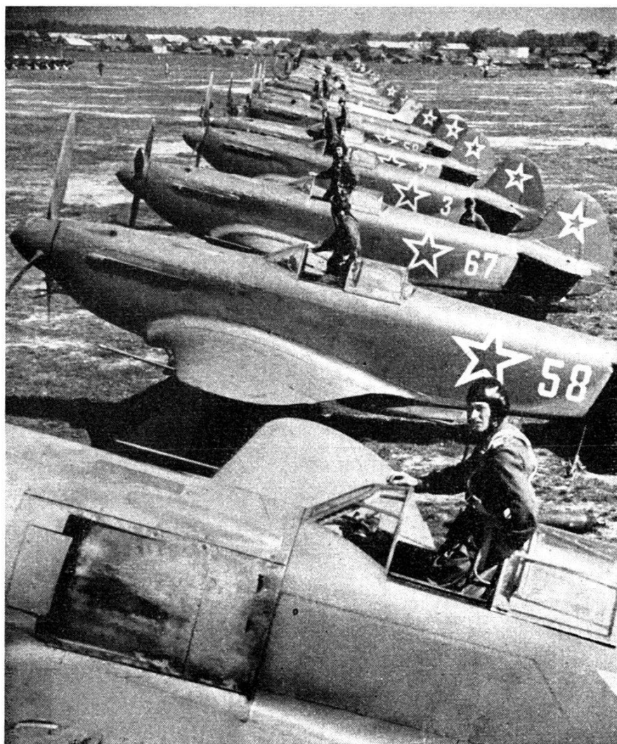
Chasseurs « Lavotchkine 7 » au départ.