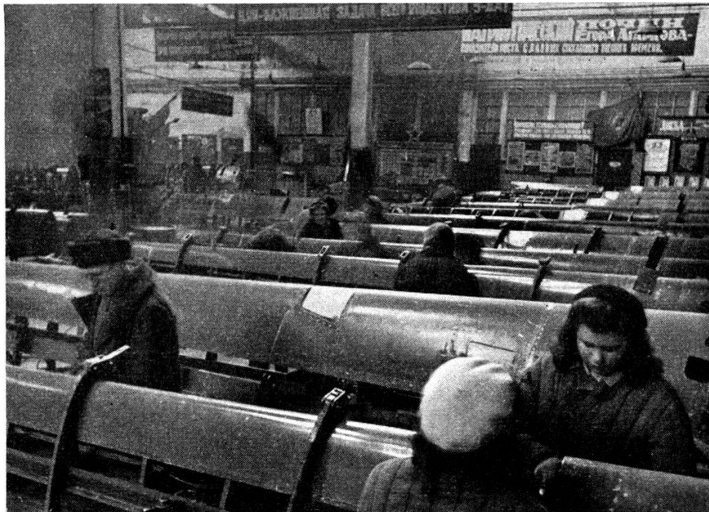
Des avions d'assaut « Iliouchine » au montage dans une usine.

Pourtant, dès le premier décennat du régime soviétique des avions fabriqués par nous sillonnèrent le ciel de notre pays. C'était les premiers pas d'une industrie qui allait prendre un essor extrêmement rapide au cours des plans quinquen-