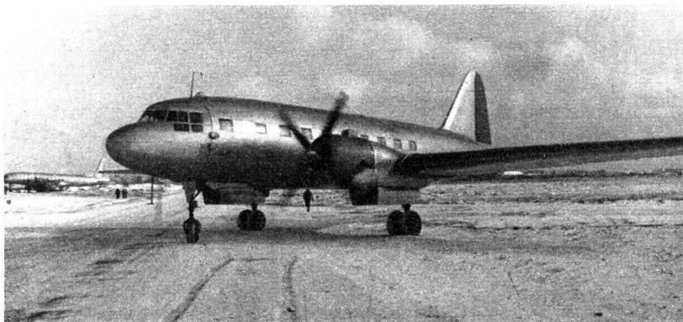
« Ilouchine 12 » bimoteur pour 27 passagers et 4 hommes d'équipage.

Le général Michel Gromov vient de me recevoir dans cette même Maison des aviateurs où l'on ne voit plus de