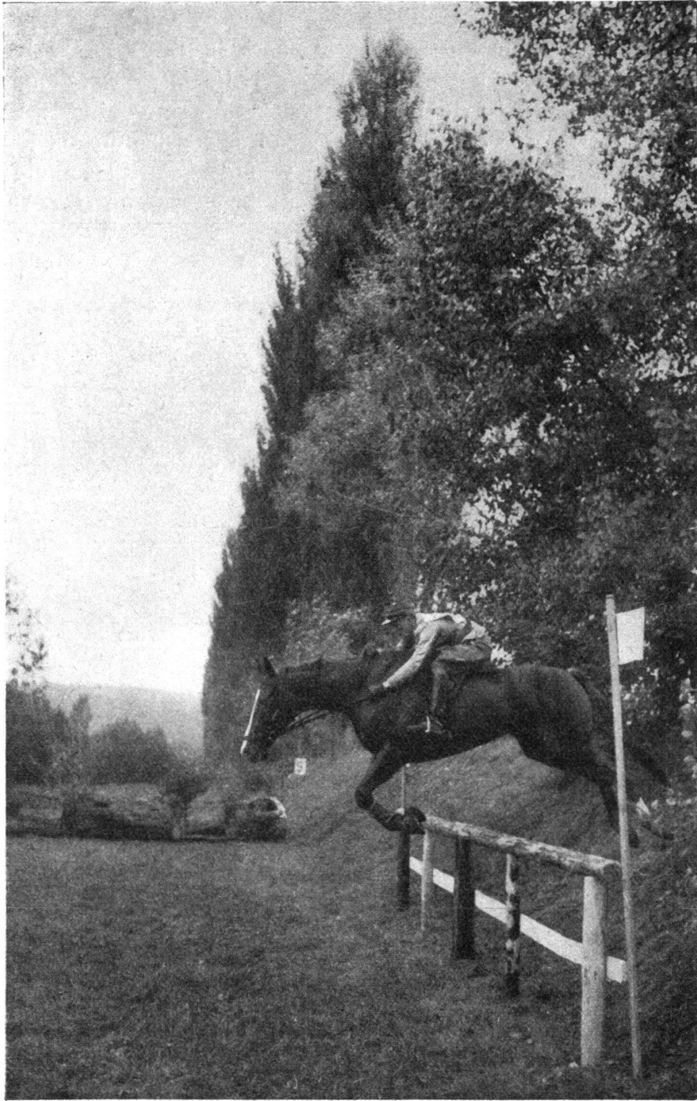
FIG. 1. — Un des obstacles du Military pré-olympique de Flaach, que franchit ici le lt. Streiff, sur Versuch .