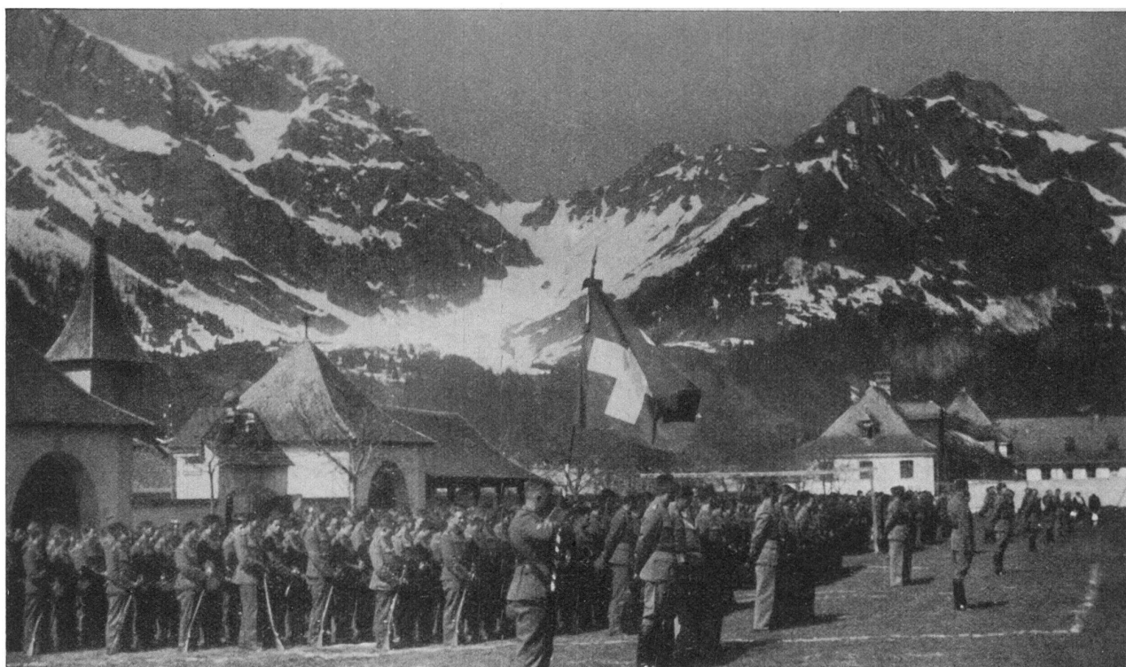
Culte militaire d'un bataillon.