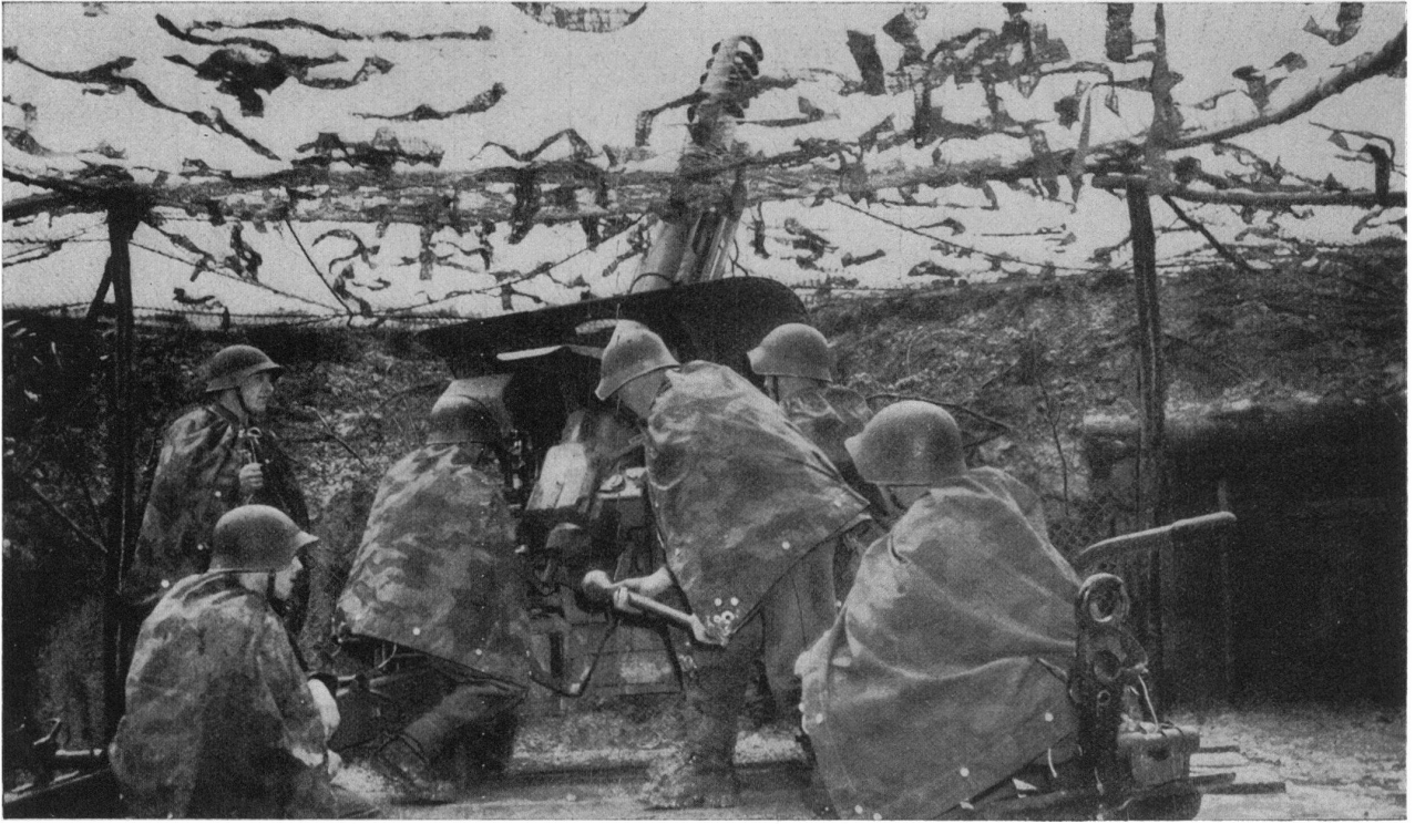
Une équipe de pièce, au travail.