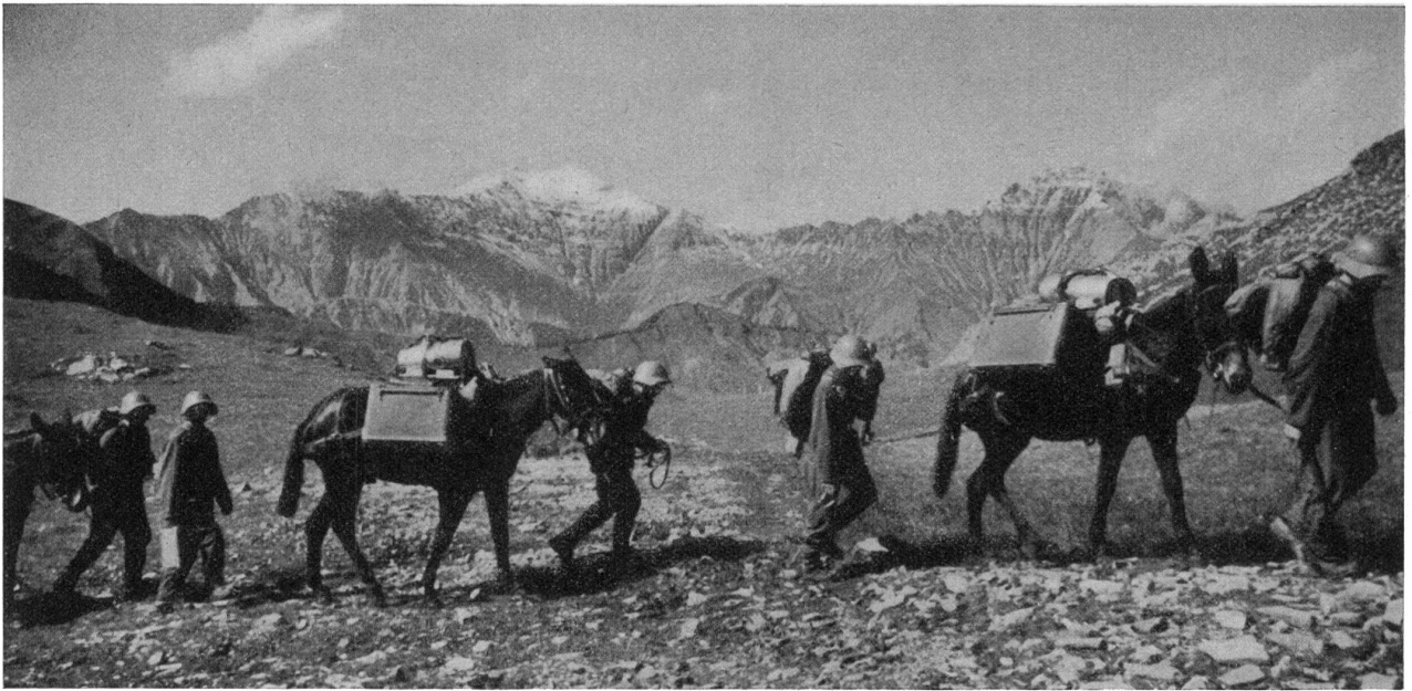
Mulets bâtés, en montagne.