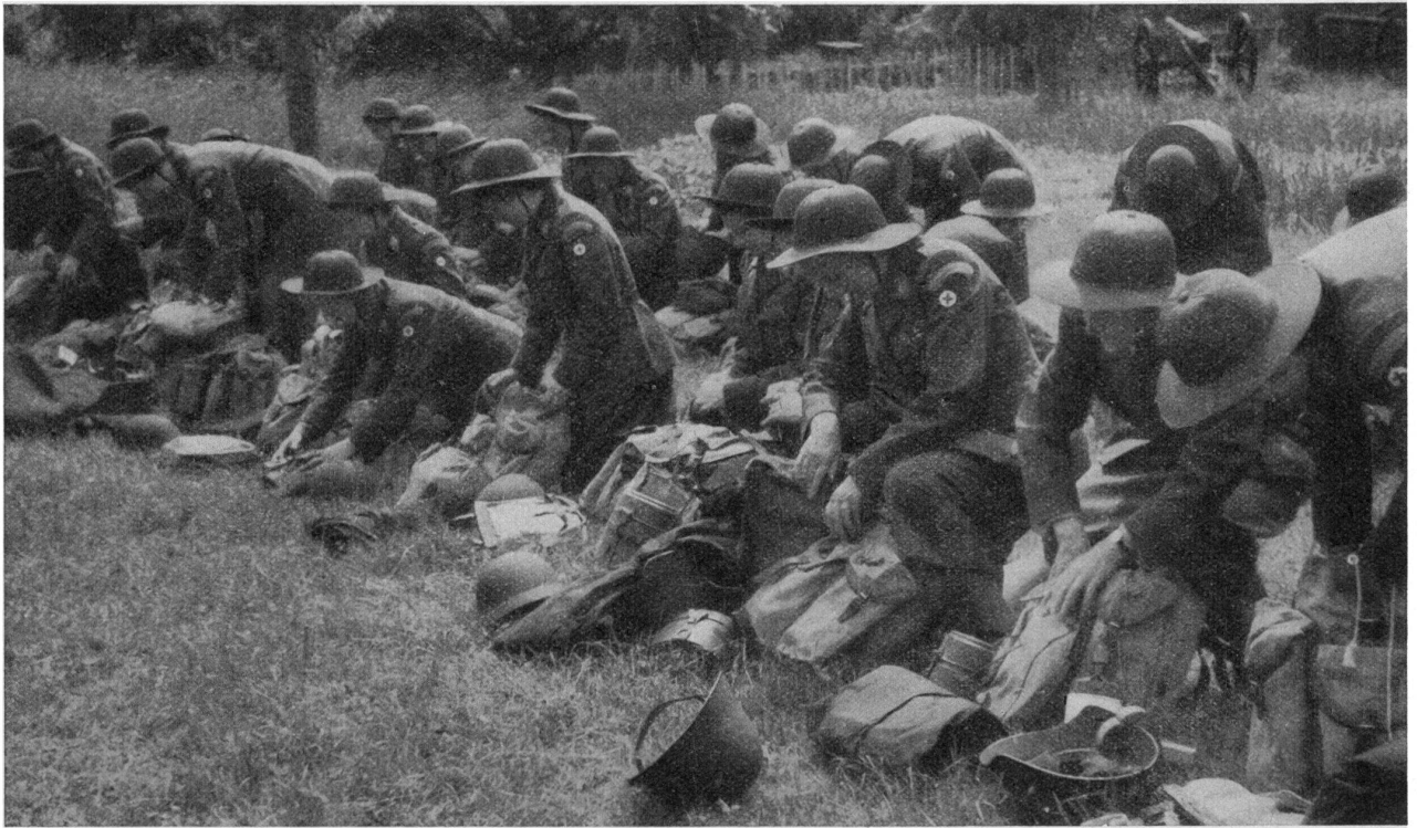
S. C. F. Préparation au départ.