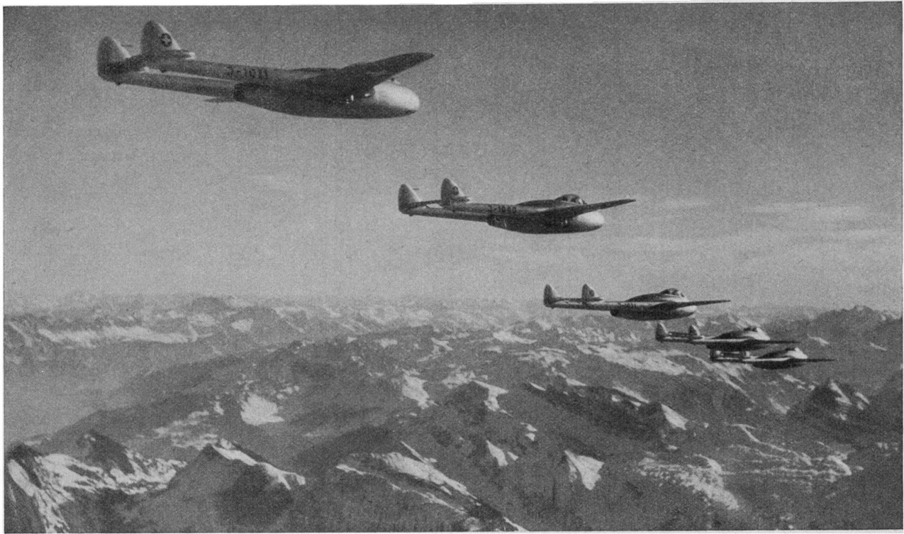
L'avion de chasse « Vampire ».