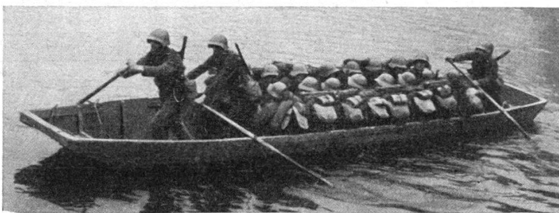
FIG. 3. — Nacelle de traversée avec groupe de fusiliers.

position d'attente et sont amenées par groupes dans la proximité du cours d'eau à franchir. La route à suivre est jalonnée par la police routière. Les camions stoppent en un point éloigné de quelques kilomètres afin que leur bruit ne trahisse pas les préparatifs de l'opération, ce qui anéantirait l'effet de surprise nécessaire au succès. Aussitôt, les hommes du génie déchargent les nacelles, placent chacune