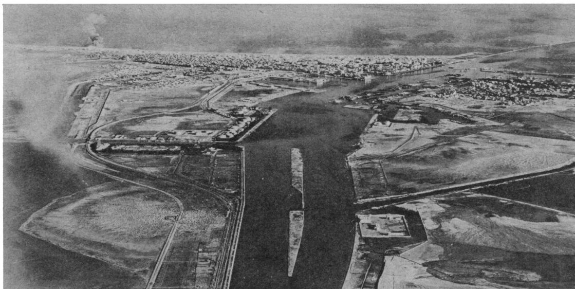
Vue générale de Port-Saïd, à l'ouest, et de Port-Fouad, à l'est. L'aérodrome de Gamil se trouve à gauche de la grosse fumée. A l'entrée du canal se remarquent les bateaux coulés. Sur la partie gauche on distingue la voie ferrée, qui s'incurvera plus loin vers le delta, et la route suivant le bord du canal. Immédiatement au sud du canal de dérivation, entourés d'arbres, les bassins de l'usine de purification d'eau et son château-d'eau, plus à gauche. Les citernes rondes sont les réservoirs de carburant de la Compagnie. Port-Fouad n'a pas de dégagement vers le sud et se relie à Port-Saïd par bateaux.