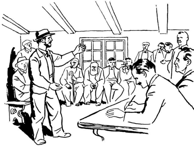
Nos communes - Droit de bourgeoisie - Administration autonome

La première partie rassemble, parfaitement bien résumés, les principes de base qui étayent l'existence même de notre pays. Ces chapitres sont une véritable charte de nos privilèges, et on ne peut que se féliciter de les voir exposés aussi largement au début de ce « Livre du Soldat », où ils trouvent si naturellement place. Les devoirs qui résultent de ces droits, de ces privilèges dont nous sommes, à juste titre, fiers, en découlent dès lors comme une suite normale. La Défense nationale d'aujourd'hui apparaît comme la continuation logique de quelque sept siècles de luttes, pour des libertés que l'histoire nous montre toujours remises en question, et que nous devons nous garder de jamais croire définitivement acquises. On n'aurait mieux su choisir d'introduction à la vie militaire que ce large exposé de ce qui est, somme toute, sa justification et sa raison d'être profonde.