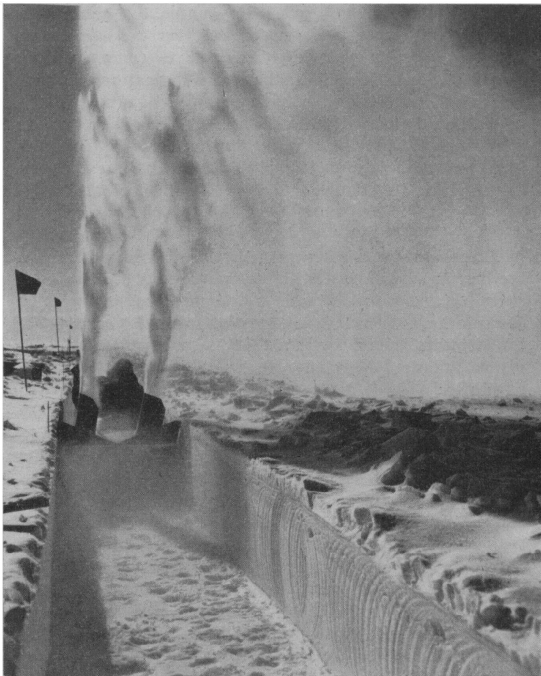
Machine à tailler la couche de glace ou de neige, en action au Groenland, en vue de l'installation d'un habitat en profondeur.