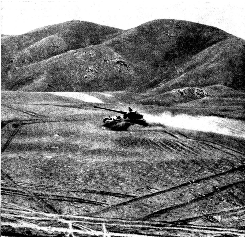
Un char AMX en mouvement dans les sables.

Et, le 2. 11 seulement, il le rejoignit près de Bir Gifgafa où, vers 1400, un combat de chars s'engagea et dura jusqu'à la nuit. Les AMX français, qui se mesuraient aux T 34 et aux SU 100 russes, firent preuve, dans les sables et dans les éboulis, de beaucoup de maniabilité, et leur excellent canon de 7,5 cm. — qui avec 1000 m. de Vo lance un obus capable de percer un blindage de 14 cm. à 1,5 km. — se montra tout à fait suffisant sur les chars lourds très modernes de la « Brigade russe ». Même si nous n'ignorions pas les avantages de