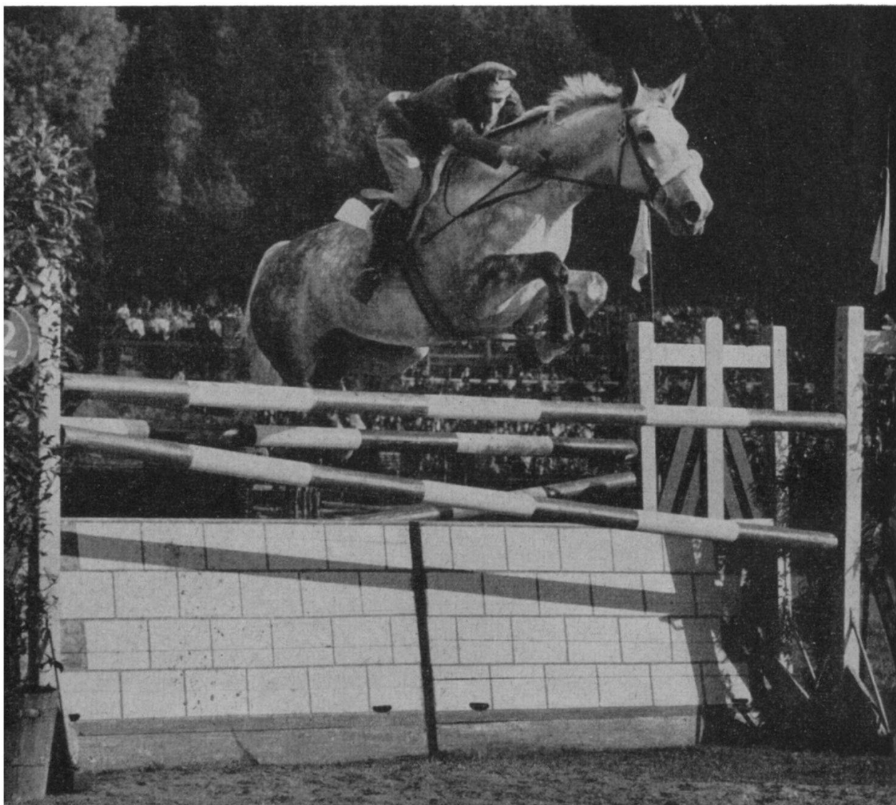
3. Le cap. italien Piero d'Inzeo a été de victoire en victoire au cours de 1958, et de capitale en capitale. Le voici achevant avec l'un de ses splendides sauteurs irlandais, The Rock , un parcours gagnant en une épreuve maîtresse du C.H.I.O. de Rome. Le cap. Piero d'Inzeo et son frère, le cap. Raimondo d'Inzeo, sont pris pour modèles même par leurs pairs les plus réputés.

largement le cadre de ce débat, mêlant en ses pages harmonieuses uniformes et classiques tenues d'équipage. A travers toute la revue souffle l'esprit de l'élite mondiale, cet esprit fait de risque mesuré et affronté, d'estime de l'adversaire