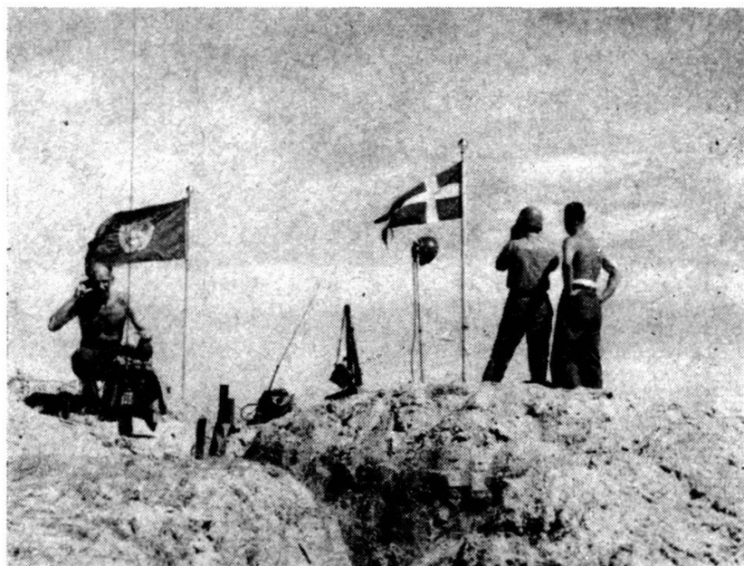
Poste d'observation suédois dans le désert du Sinai.

militaire — puis de le contrôler ; de surveiller ensuite le retrait des troupes étrangères du territoire égyptien ; enfin de maintenir la paix dans la région en se déployant le long de la ligne de démarcation de l'armistice 1 , dans la zone de Gaza et, en direction du sud, le long de la « frontière internationale » 2 , ainsi que dans la région de Sherm el Scheik, sur la mer Rouge, au sud-est du Mont Sinai.