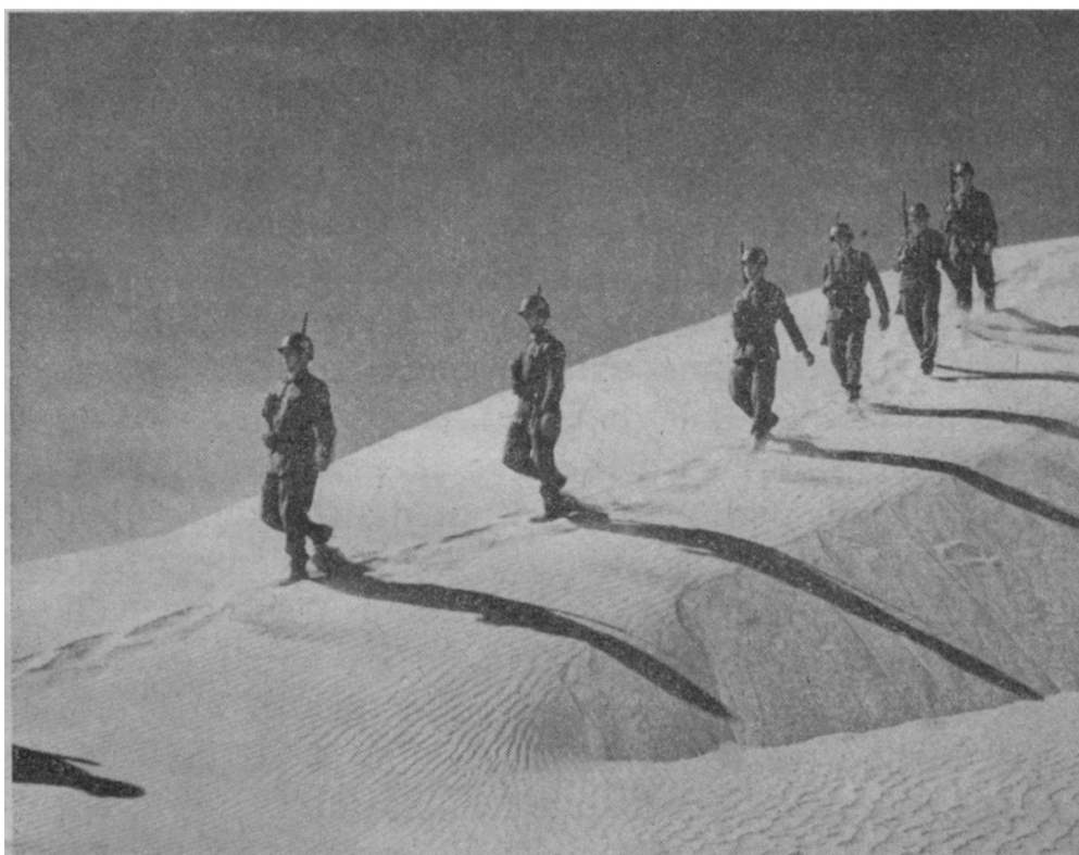
Patrouille yougoslave près d'El Arish.

En 1959, le lieutenant-général Burns a été remplacé à la tête de la F.U.N.U. par le major-général Gyani de l'Armée indienne. Et l'effectif total des troupes — à base d'infanterie — s'est maintenu aux environs de 5000 hommes, fournis actuellement par le Brésil, le Canada, le Danemark, l'Inde, la Norvège, la Suède et la Yougoslavie.