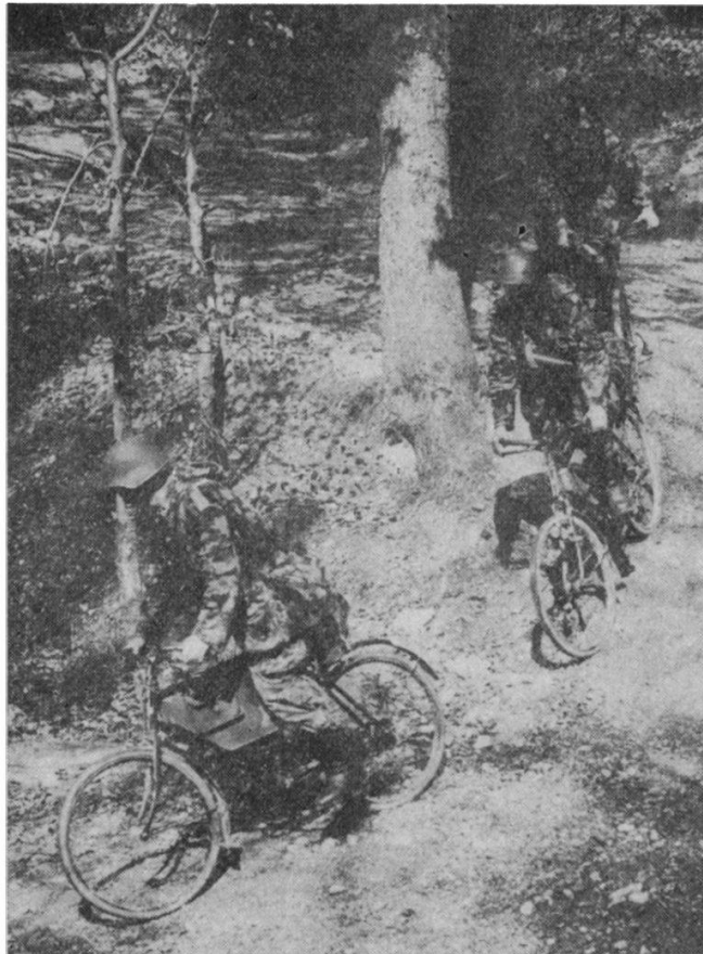
Fig. 3. — ... leur faculté de se mouvoir dans tous les terrains ...