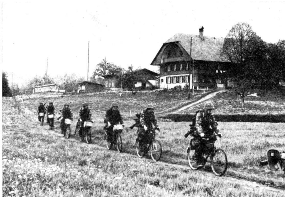
Fig. 1. — Les cyclistes se déplacent rapidement, même sur des sentiers, et ne représentent pas de but rentable pour l'aviation.

Les cyclistes ne sont pas la fierté des cantons; l'effort et l'endurance exceptionnels que demande la propulsion de leur machine est de loin