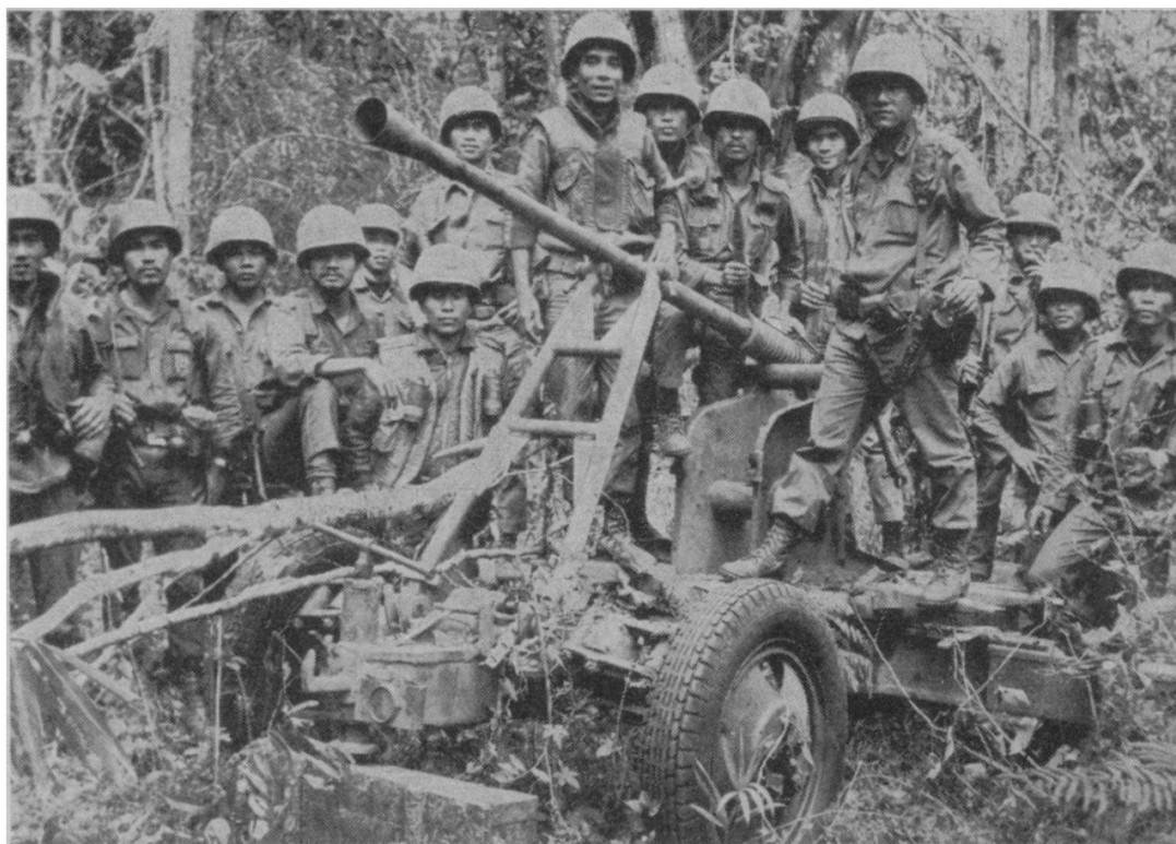
Un lieutenant-colonel sud-vietnamien avec ses hommes entourant une pièce de l'armée nord-vietnamienne, lors de l'opération Lam Son 719.

mienne à l'actuelle opération Lam Son 810 démontre aussi que les troupes de Hanoï ne veulent pas et ne peuvent pas lancer d'offensive importante au Vietnam du Sud même, dûment touchées qu'elles ont été par l'offensive sud-vietnamienne de février et mars. Certes après être