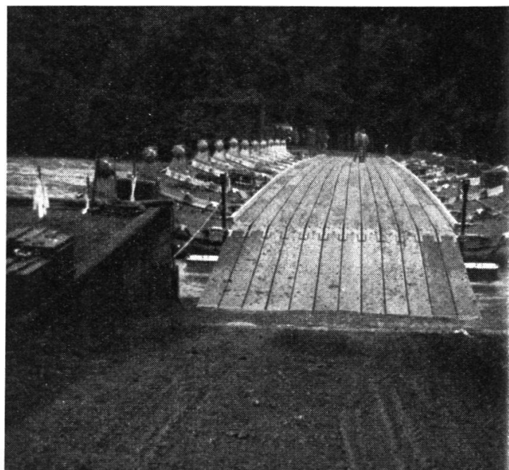
4. Le pont flottant terminé permet le franchissement de véhicules de 50 t.