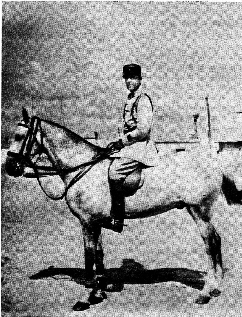
1 er bataillon: le commandant.

Ces corps de troupe collaboreront — nous le verrons plus loin — avec diverses formations dont notamment des unités d'automitrailleuses, de chars blindés, de tirailleurs marocains, des détachements d'artillerie et du génie, des escadrilles d'aviation, le service du train, sans oublier les forces supplétives (goums).