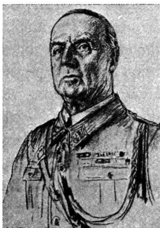
Portrait du lieutenant-colonel de Tscharner, d'après l'artiste neuchâtelois L'Eplattenier.

Superbe soldat, d'une bravoure légendaire, dans la nuit du 10 au 11 mars 1928, lors de l'incendie d'un dépôt de cheddite situé dans le camp de son bataillon, fit preuve de décision et d'un remarquable sang-froid en organisant les secours d'une façon parfaite. Sérieusement blessé par un éclat de pierre qui lui fracassa la jambe, fit preuve de stoïcisme et de grandeur d'âme ignorant sa douleur pour ne penser qu'à ses braves légionnaires. » 1