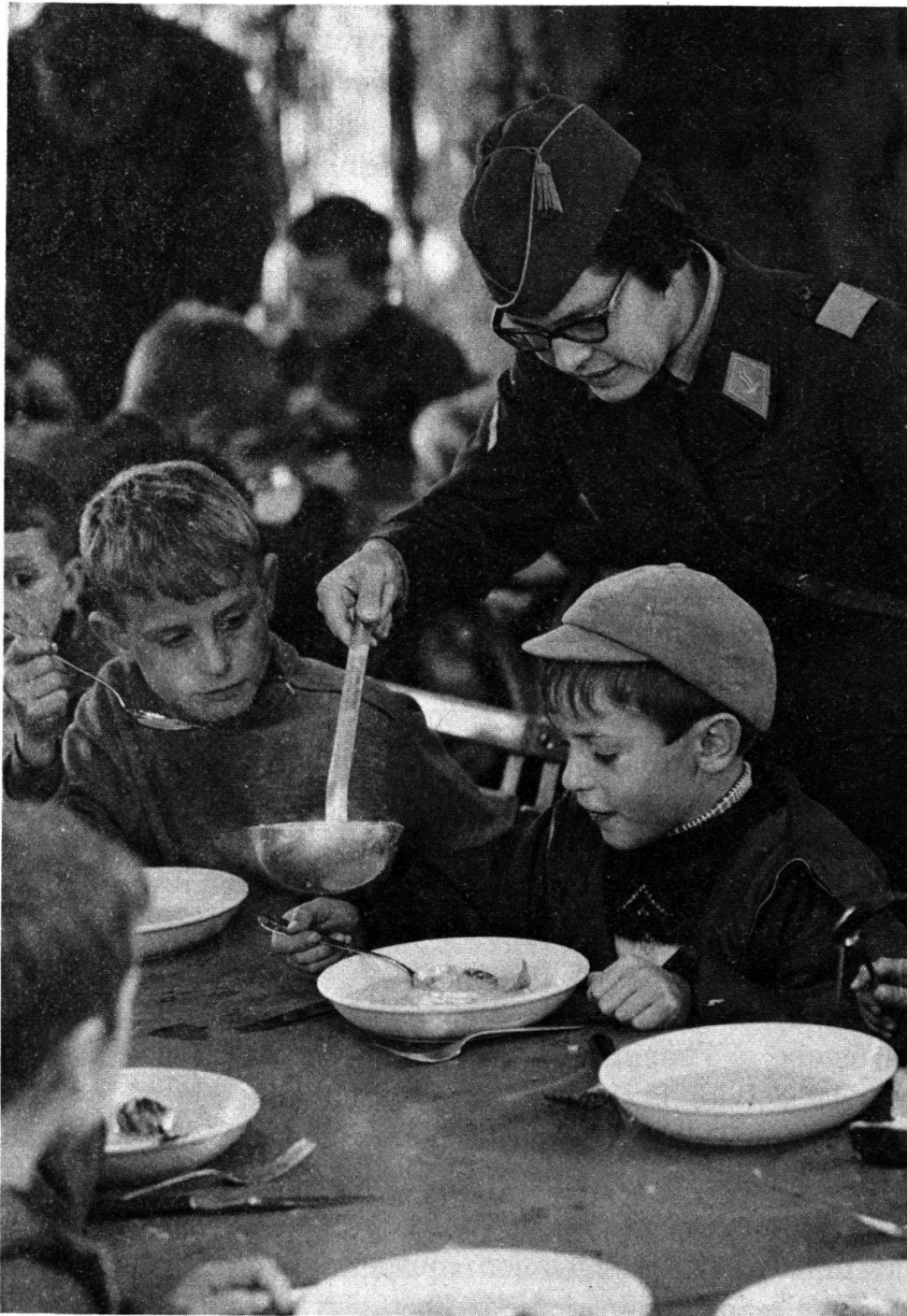
Fig. 5 — SCF du service d'assistance.

bution de nouvelles tâches et de nouveaux champs d'activité au Service féminin. Maintenant que la situation de la femme dans la société actuelle est devenue, en cours d'évolution, celle d'une partenaire égale de l'homme et que la femme dispose, dans le domaine économique, des