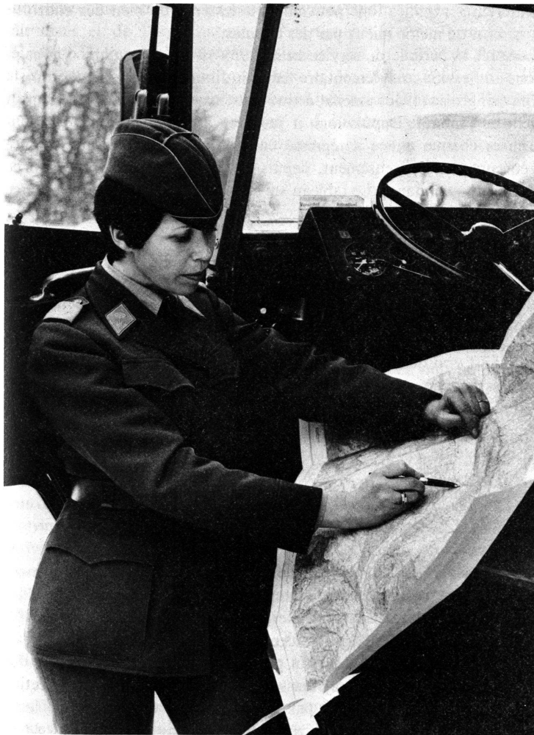
Fig. 4. — SCF du Service des automobiles (conductrice sanitaire).

(aujourd'hui: 1590.—), tandis que l'acquisition équivalente pour une recrue de sexe masculin s'élevait à Fr. 710.— (actuellement: 1880.—).