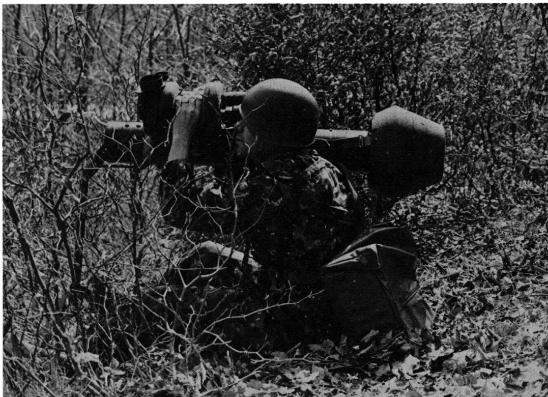
L'engin filoguidé antichar «Dragon» a une portée de 1000 mètres.

toucher leur but à 2000 mètres, leur incorporation dans l'armée de campagne sera maintenue. Non seulement l'apparition du «Dragon» n'impliquera la suppression d'aucune de nos armes existantes, mais au contraire, elle exigera, on s'en doute, la création de deux autres places d'instruction antichar 1 . Les écoles antichars de Chamblon perdront donc leur unicité. Mais Chamblon restera le centre de formation des canonniers, des tireurs d'engins «Bantam» et «Dragon» ainsi que des officiers antichars.