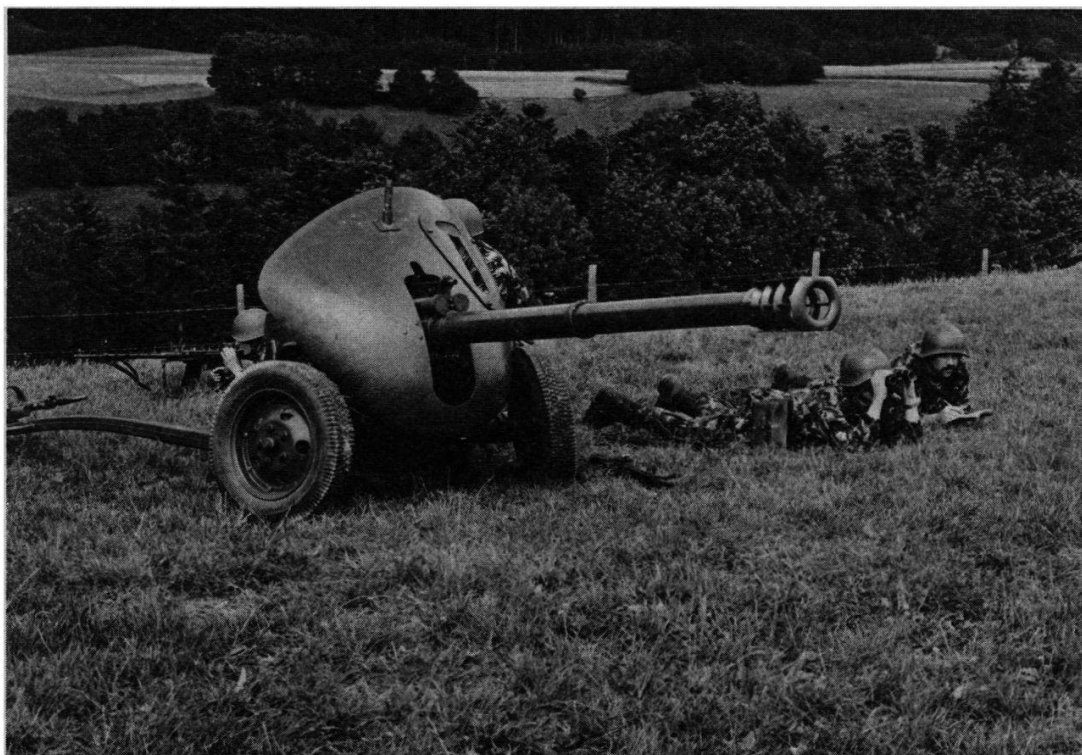
Le canon antichar 57 équipe les brigades frontières.

En été 1958, le nouveau canon antichar de 9 cm 57 fait son apparition à Yverdon. De construction suisse également, il est le fruit des expériences acquises avec le modèle précédent. Bien qu'il ne présente pas de différences fondamentales avec le canon antichar 50, il a toutefois pour caractéristique d'avoir une portée nettement supérieure (700 m).