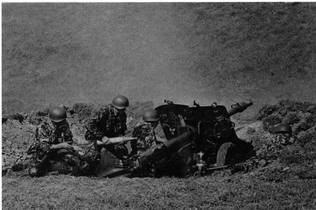
En position pour le tir indirect avec obus explosifs: le canon antichar 50.

On en était en fait aux premiers balbutiements en la matière et il fallait tout inventer ou presque. Pour souligner l'effort qui devait être consenti, il suffit de rappeler que ce n'est qu'en 1953 que les écoles de recrues de canons d'infanterie renoncèrent à la traction hippomobile.