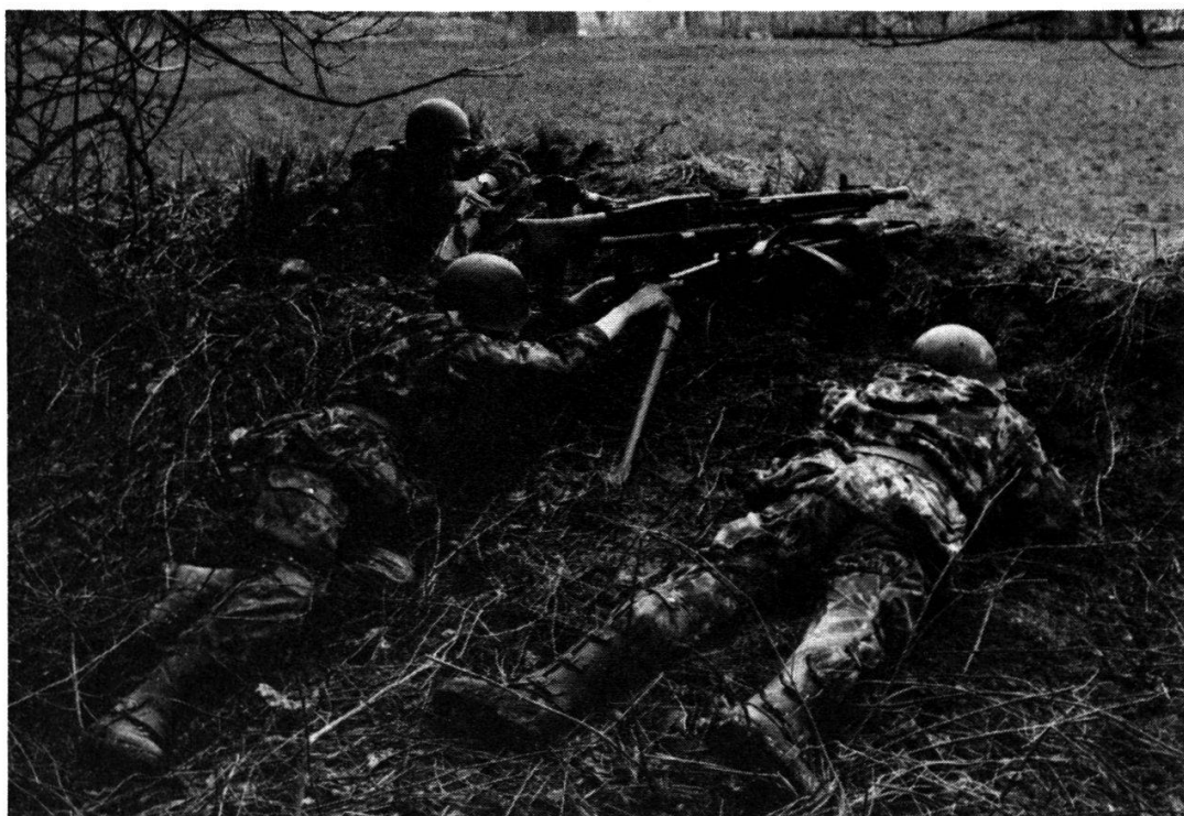
L'infanterie de montagne sait se battre

Les sections de lance-mines: équipées chacune de 4 pièces de lance-mines de 8,1 cm, dont la portée maximale est de 4 km, les sections de lance-mines bénéficient, en plus de l'instruction de base propre à chaque soldat d'infanterie, d'une formation propre à leur permettre