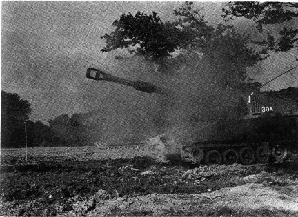
L'obusier blindé M 109 (calibre 15,5 cm).

tirent par pièce individuelle après de nombreux exercices de prise de position.