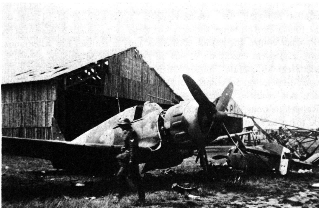
Camp d'aviation de Poitiers. 8 juillet 1940. « Feldgrau » passant devant un Bloch 152 saboté par les Français. A cet instant, un pilote de DO.17 basé ici, s'écria: « Und jetzt... schnell nach England! »

Après le choc de juin 1940, il fallait relever la tête et nous dirigeons nos regards vers l'Angleterre, malgré la tragique journée du 3 juillet à Mers-el-Kébir. Nous écoutions la BBC et nous nous réconfortions par la présence du général de Gaulle à Londres qui s'efforçait de prouver l'existence d'une France. Nous ne pouvions pas imaginer à l'époque l'ampleur de la bataille morale qu'il menait et la glorieuse épopée qui allait suivre. Nous étions aussi fort nombreux à nous accrocher, comme des enfants, au maréchal Pétain, en dépit de la « poignée de mains » du 25 octobre 1940 à Montoire, après les entretiens Hitler-Laval du 22 en ce même lieu et Hitler-Franco à Hendaye le 23 octobre (j'ai pu voir, près de Poitiers, un convoi insolite, survolé par des Me 109, qui n'était autre que le train « Erika » filant vers Hendaye). Nous pensions que le maréchal jouait le jeu par obligation, en lâchant du lest d'un côté pour sauver le plus possible de l'autre.