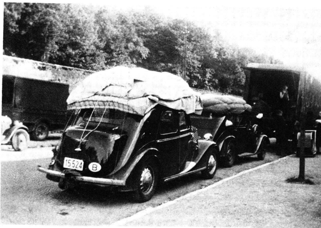
Passage de réfugiés à Poitiers, près de la gare, le 16 juin 1940.

Qu'avait à opposer la France à ce fer de lance? Les bons vieux Renault FT 17? On avait tendance à le croire. L'écho du leitmotiv «Nous n'avions presque pas de chars et pas d'aviation» résonnait d'une région à une autre pour sortir du pays, et les ondes de choc parviennent encore de nos jours à nos oreilles! Toutefois, la vérité