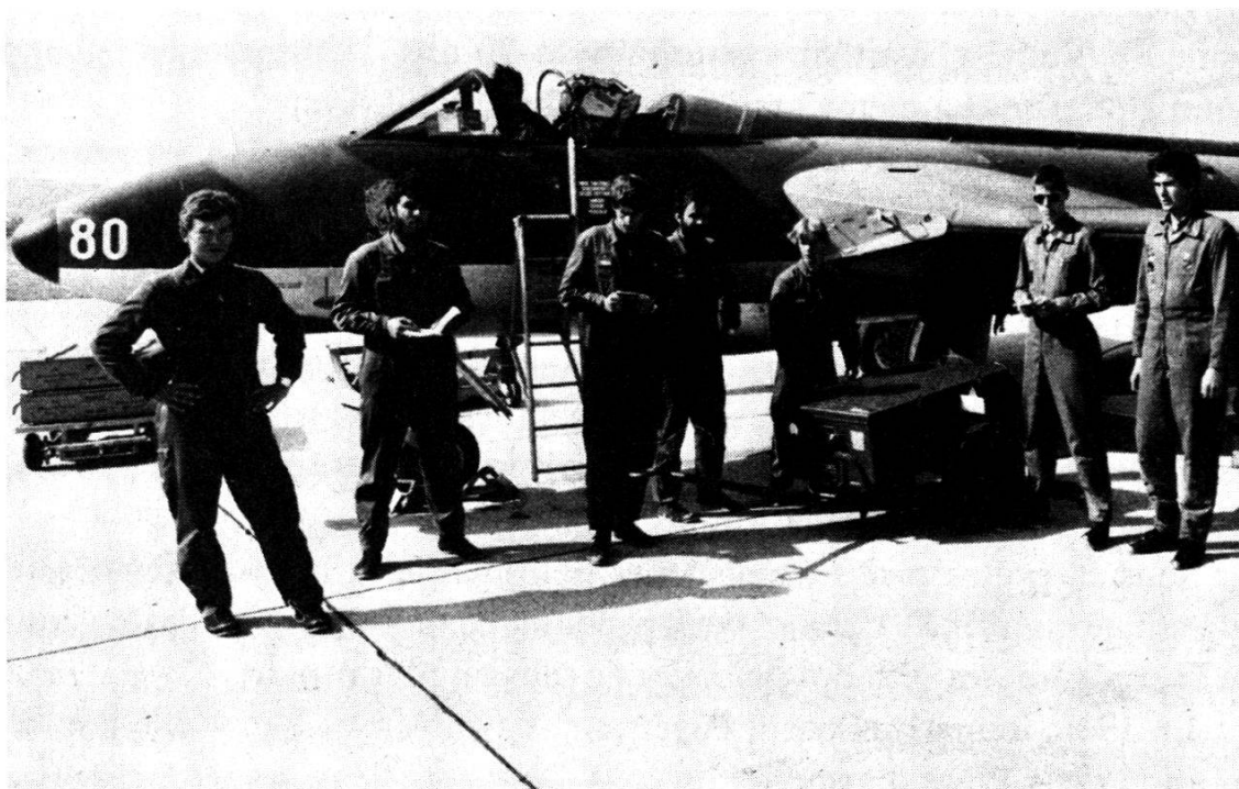
Fig. 1: Travail d'équipe: la préparation au vol.

L'ESO/ER aviation est la seule école en Suisse chargée de la formation de l'ensemble du personnel technique de l'aviation militaire.