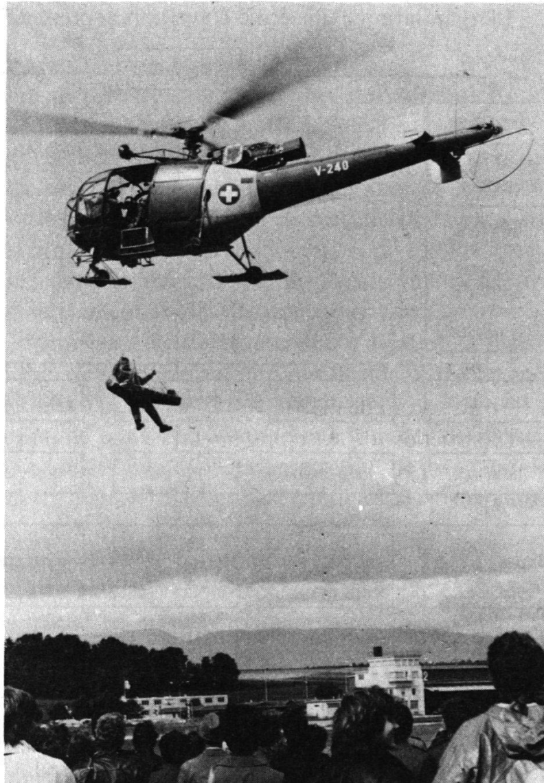
Fig. 4: l'aviation légère en mission de sauvetage