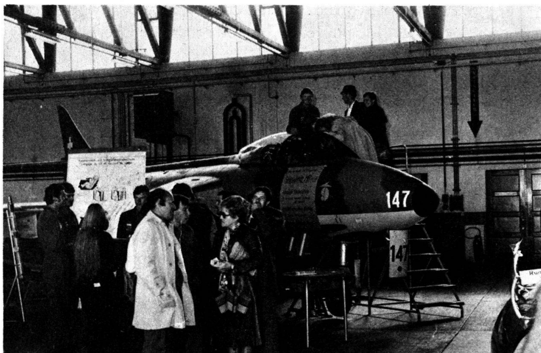
Fig. 2: Les « coulisses » indispensables : la réparation.

Cette organisation de base ne comprend que des officiers et sous-officiers instructeurs et ne subit que des adaptations mineures après plusieurs écoles, voire plusieurs années pour certaines fonctions. Le