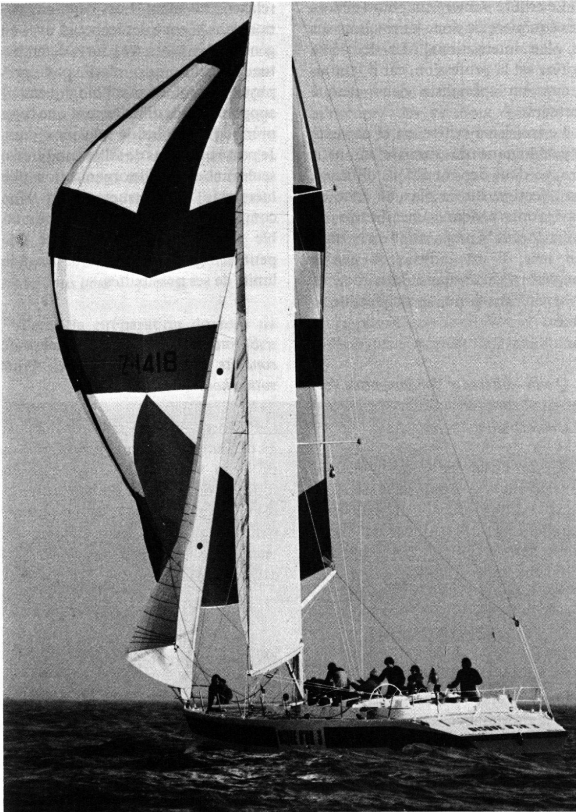
Disque-d'Or 3, quatrième de la course autour du monde 1981-82.