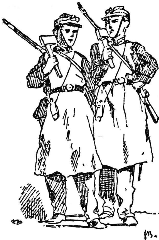
Les sapeurs de Vevey

appel très patriotique 6 . En 1860, il enseigne la gymnastique aux recrues de l'artillerie, à Aarau; l'année suivante, il obtient un subside fédéral pour un séjour d'étude en Prusse, puis il publie, en 1862, un «Manuel de gymnastique» pour les troupes fédérales 7 . Enfin, la Société militaire fédérale, réunie à Lugano en 1861, discute «De la fusion de l'instruction