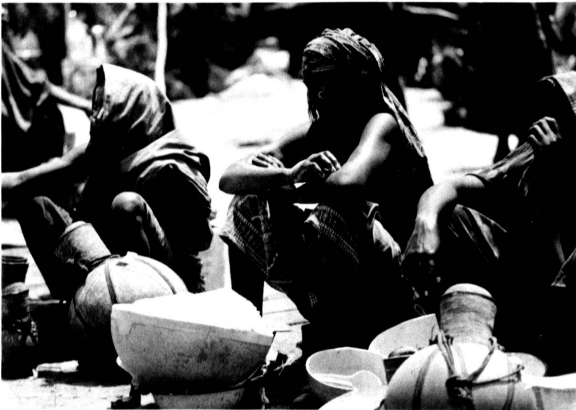
Sur le marché d'Abéché ces vendeuses offrent à bon compte boire et manger.