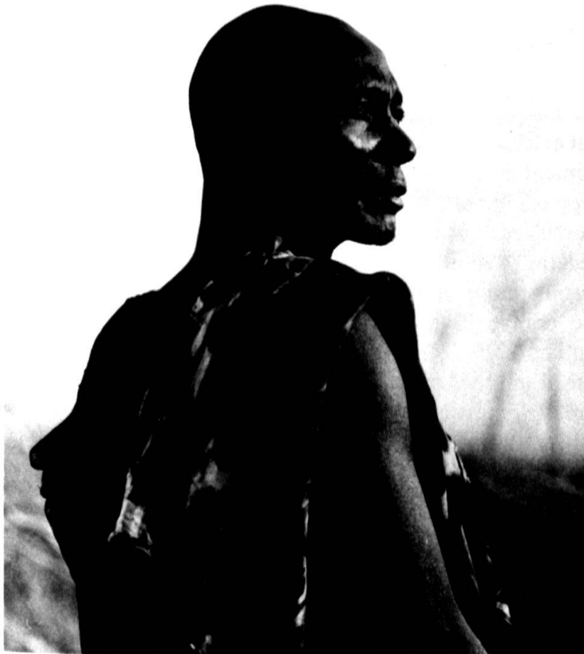
En brousse, sur les bords du Chari.