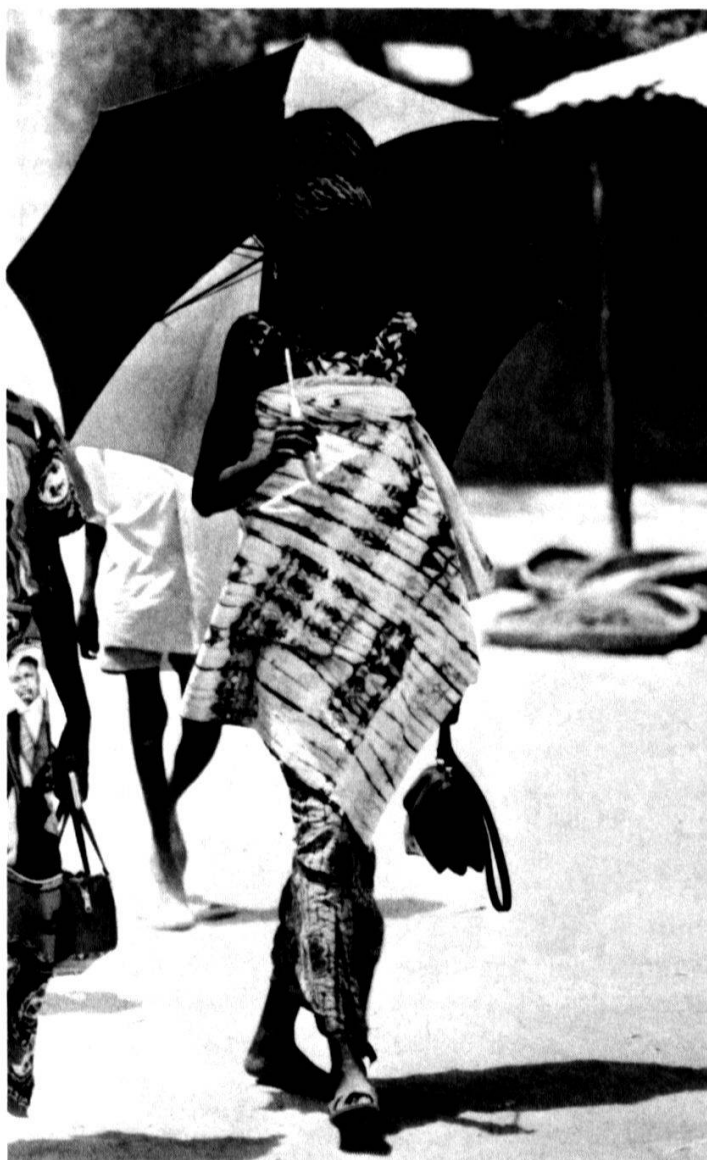
Une élégante dans les rues de N'Djamena: l'administration et ses fonctionnaires donnent à la capitale son style propre.

A l'indépendance, le président Tombalbaye s'entoure de ministres saras. Lorsque l'armée française quitte