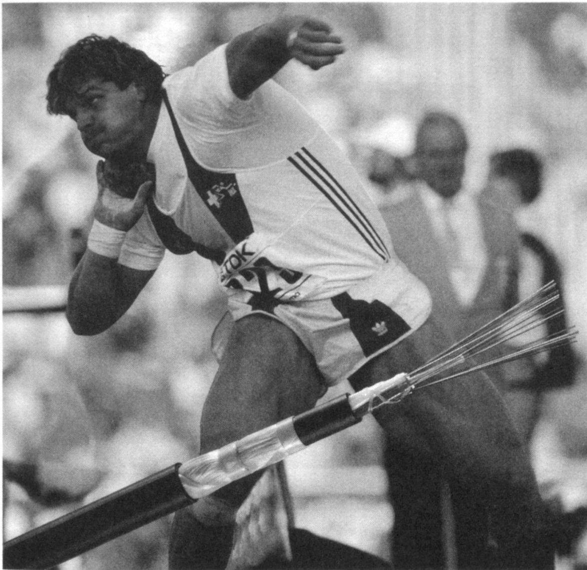
Werner Günthör, champion du monde du lancement du poids. Sous une tranquillité apparente... une énergie fulgurante.