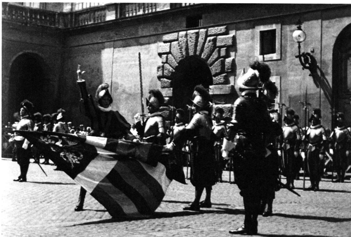
Prestation de serment lors d'un 6 mai, moment solennel et émouvant non seulement pour les jeunes recrues, mais également pour les parents, amis et invités qui vivent la cérémonie dans la cour Saint-Damase.