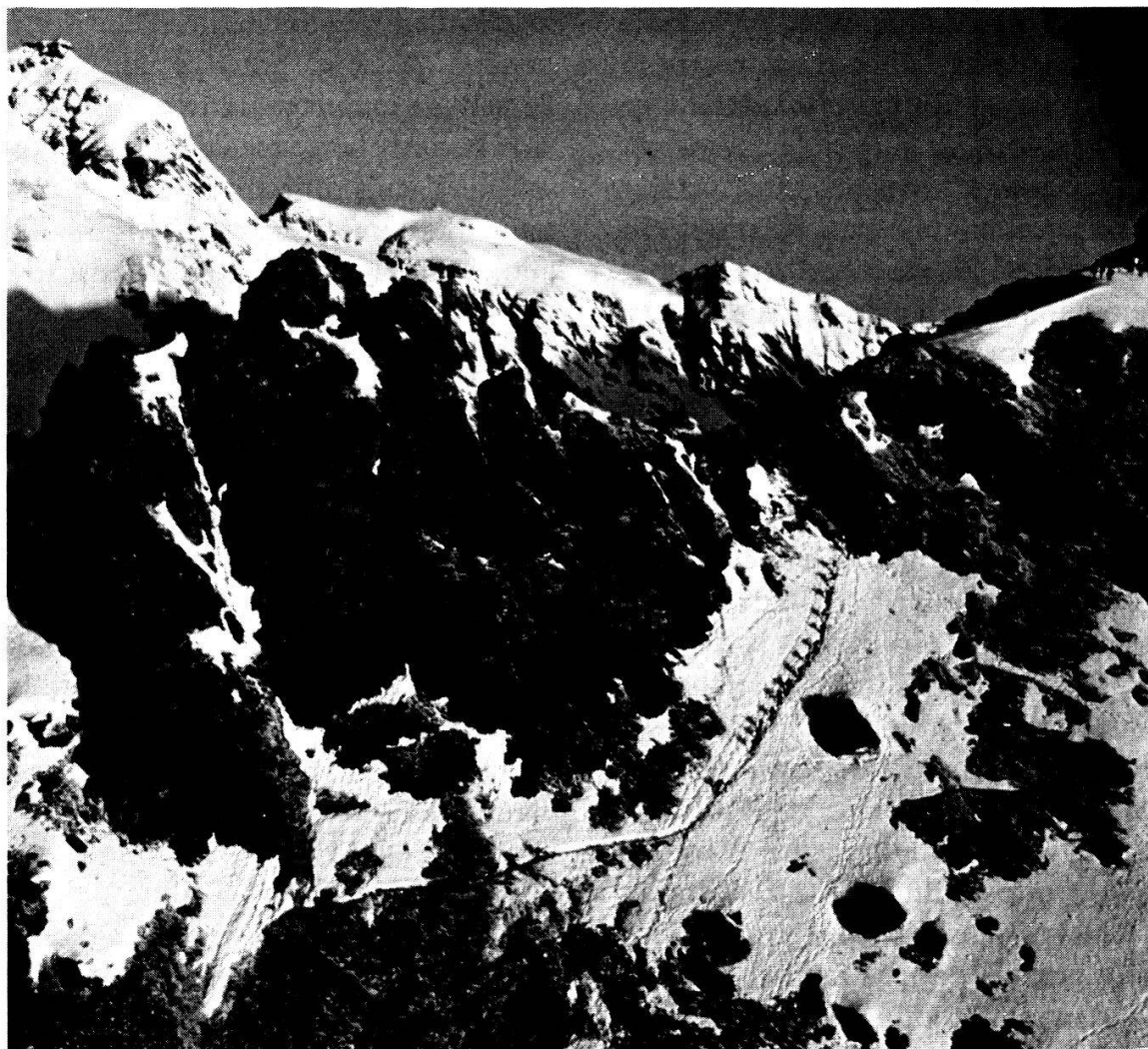
Passage du Col de Riedmatten, Patrouille des Glaciers 1984.

Le présent texte constitue un abrégé d'un article publié par le « Staatsbürger » sous un titre analogue.