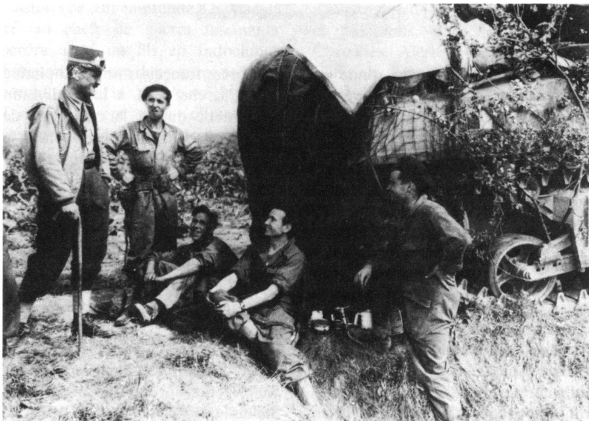
Août 1944, Normandie. Le général Leclerc converse avec l'équipage d'un char de la 2 e cie du 501 e RCC.