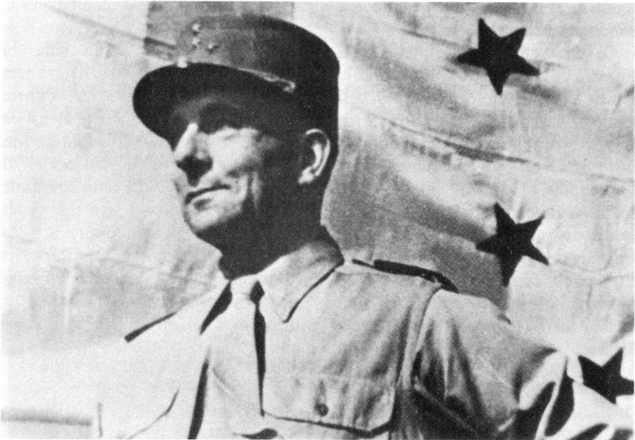
Provence 1944. Le général de Lattre s'apprête à débarquer.