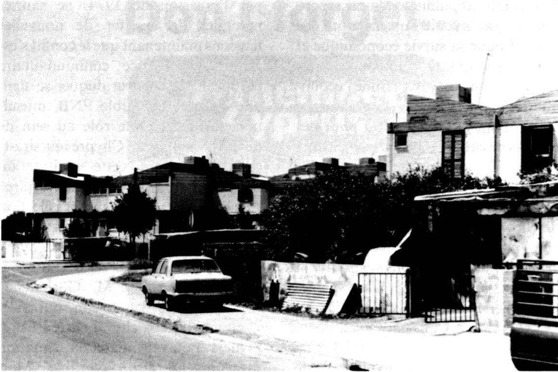
Aujourd'hui, les réfugiés chypriotes grecs sont relogés dans des cités construites aux frais du gouvernement, ainsi qu'avec l'aide de fonds de l'ONU, comme ici à la périphérie de Nicosie.

giés chypriotes grecs, et se rendant coupables de graves infractions au droit de la guerre et des gens. En guise de protestation, la Grèce se retira de l'OTAN 8 . Cette invasion signifiait clairement le refus par la Turquie de toute solution favorisant un rapprochement de Chypre avec la Grèce, et démontrait l'appui sur lequel la communauté turque pouvait compter. Cette dernière proclamait d'ailleurs sans tarder un Etat fédéré chypriote turc qui, à la faveur d'échanges de population, réécrivait la géographie humaine de l'île 9 et concrétisait mieux que jamais l'existence d'une entité turque.