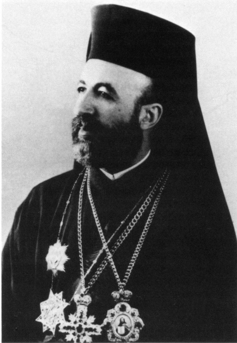
Mgr Makarios III

En 1967, la Garde nationale de la République de Chypre 5 raviva la tension en s'attaquant à une enclave turque. Ankara y répondit par d'intenses préparatifs militaires. Le conflit fut désamorcé par les Etats-Unis, et Chypre échappait pour la seconde fois à une invasion turque. En mettant sur pied une administration provisoire séparée, les Chypriotes turcs contri-