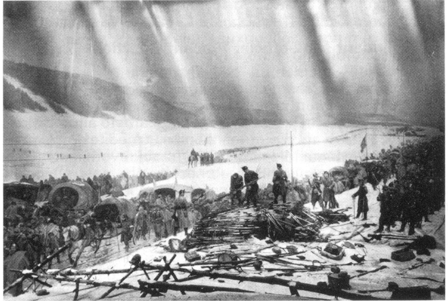
L'Armée de l'Est dépose ses armes. Panorama-Bourbaki (1 er février 1871).

Edouard Castres, le peintre, se trouvait là, au milieu des 88 000 hommes de l'Armée de l'Est, avec son fourgon-ambulance. Témoin éclairé et acteur de cette tragédie, il grave dans sa mé-