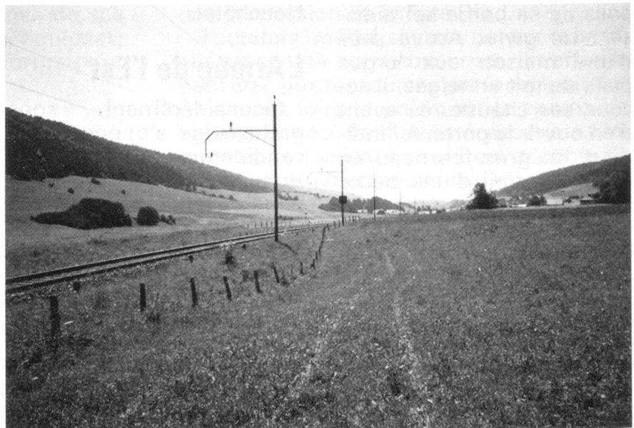
Le même endroit aujourd'hui (août 1990).

moire, telles des photographies, les scènes qu'il découvre à chaque pas dans la neige: des malheureux agglutinés autour d'un feu minuscule fait du bois des barrières de jardin, un cheval qui tombe, foudroyé par l'épuisement et le froid, un officier pâle et défait sous son casque de cuirassier, des vieux briscards que plus