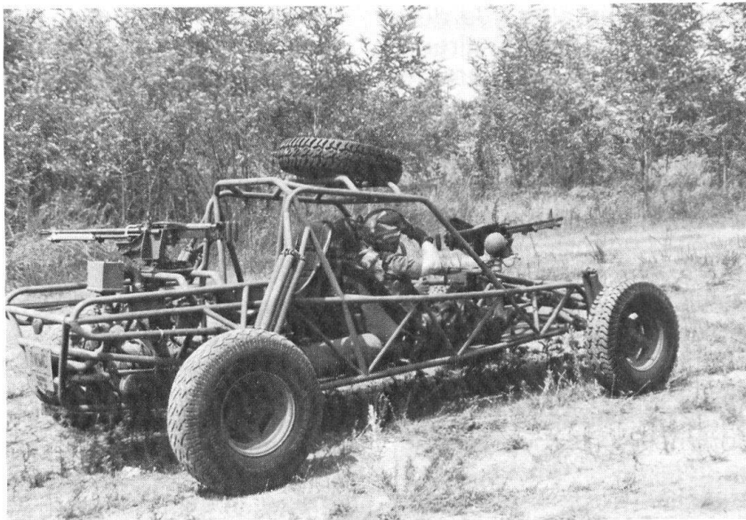
Tactique et art opératif: Le WARRIOR, utilisé par les forces spéciales US et britanniques engagées pour la recherche de renseignements, un véhicule léger, rapide, silencieux présentant une faible signature thermique et radar. Un concept de recherche de renseignements essentiellement dynamique.