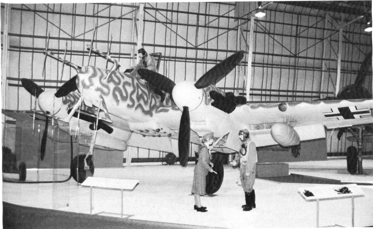
Messerschmitt Bf 109G, l'un des nombreux bijoux exposés à Hendon

Deux grands hangars, sur le terrain au nord de Londres qui vit naître l'aviation britannique, rassemblent une remarquable collection d'avions et d'objets qui vont des temps héroïques du Blériot XI au Vulcan B2 . Tous ces avions, souvent des originaux,