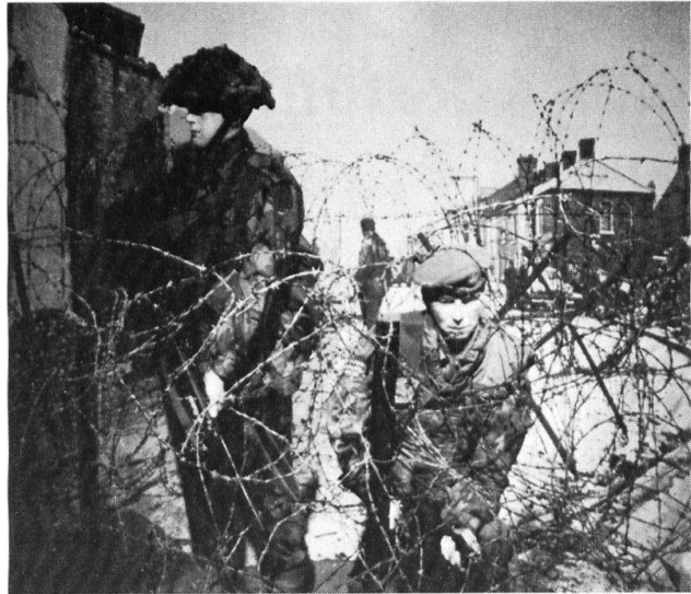
Au National Army Museum, uniformes, armes et matériels sont présentés dans leur environnement. Ici, l'Irlande du Nord

Le visiteur ne saurait ignorer ces musées plus petits que l'Imperial War Museum, qui font preuve, à leur échelle, et avec d'autres moyens, du même souci d'une muséographie de qualité et d'un respect du détail qui honore leurs responsables.