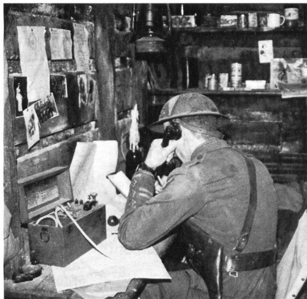
«Trench experience» à l'Imperial. Pendant que, dans son abri, le commandant de compagnie reçoit ses ordres...

Le musée se veut éducatif. Donc point de lourdeurs dans des vitrines aérées où chaque objet est mis en valeur. Des dioramas à l'échelle 1:1, des maquettes donnent vie aux uniformes et aux matériels. Partout, des écrans vidéo vous permettent d'obtenir une brève information, un film ou des photographies d'un élément du secteur où vous vous trouvez. La reconstitution d'une tranchée, avec odeurs et bruit (mais sans boue!), dans laquelle le visiteur peut se promener, lui permet de se rapprocher des conditions d'existence du soldat de la Première Guerre mondiale. Une rue de Londres lors du «Blitz» est, elle aussi, criante de vérité. Et si le cœur vous en dit, montez dans