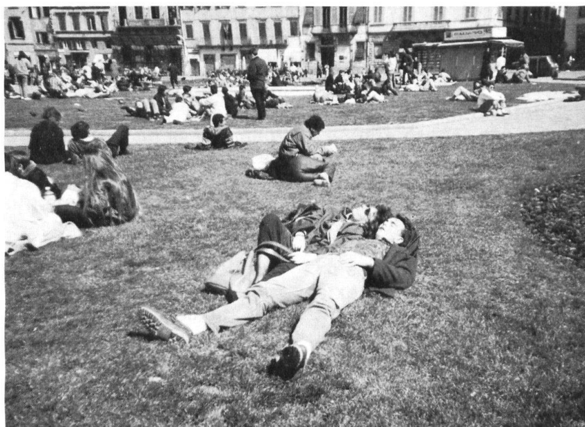
En Europe occidentale, donc en Suisse, une jeunesse très «cool», élevée dans l'abondance, a beaucoup de peine à accepter ses obligations face à l'Etat. Ce couple de jeunes fait un somme sur une pelouse de Florence, devant l'église de Santa Maria Novella... Subir une discipline de style militaire ne manquerait pas de créer chez eux révolte et stress...

»Deuxième point à améliorer: réduire le plus possible les pertes de temps. Si l'on considère le nombre de jours perdus à nettoyer, déménager, installer des places de tir, recevoir du matériel que l'on n'utilise pas, on arrive à une école de recrues raccourcie de plusieurs semaines. Pourquoi ne pas utiliser à ce genre de tâches les personnes incapables de suivre normalement, pour des raisons physiques ou intellectuelles leur école de recrues, en les sélectionnant après quelques jours d'armée? Il serait alors possible de pousser un peu plus l'entraînement des autres éléments (...).»